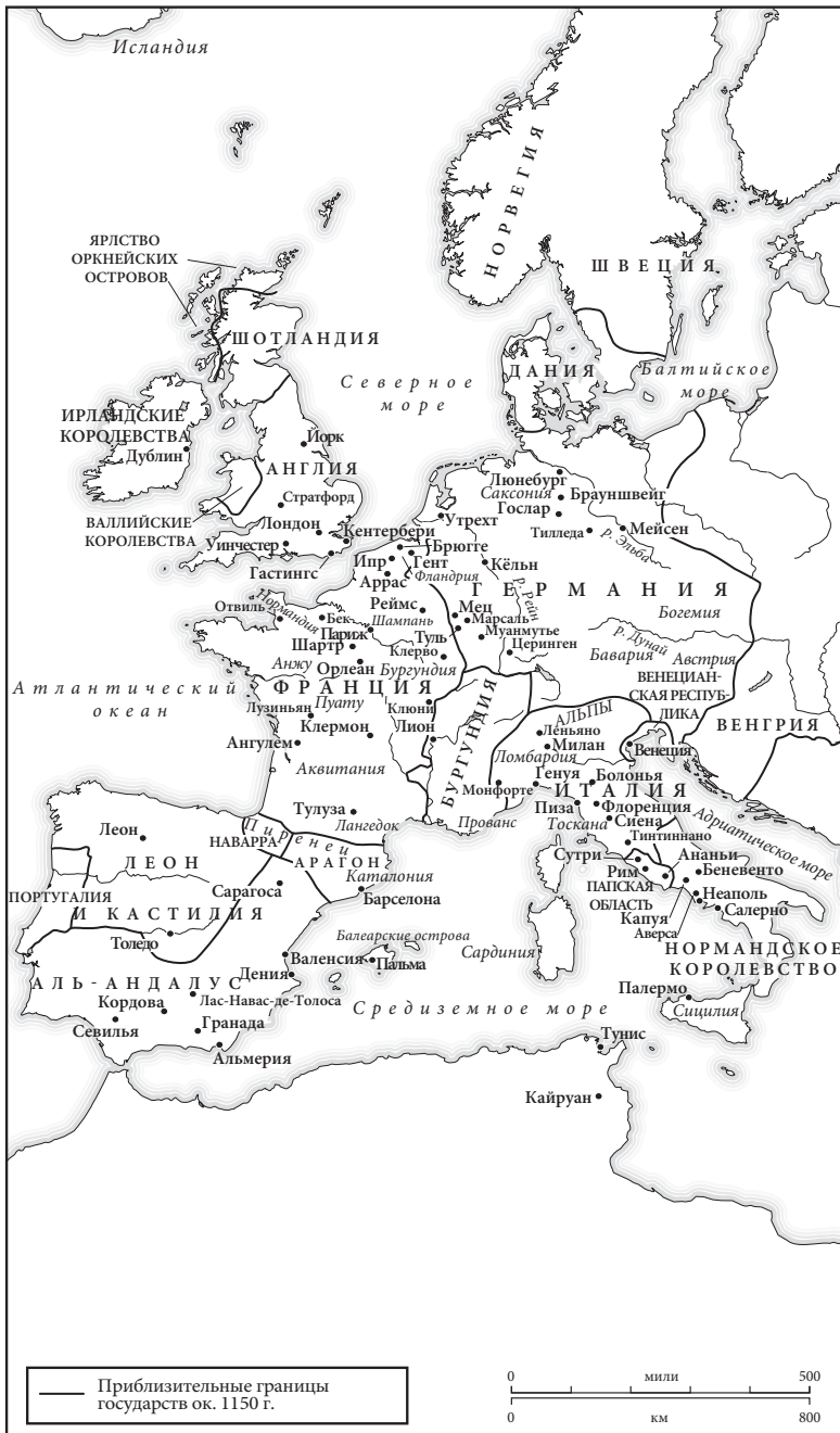
Карта 4. Западная Европа в 1150 г.