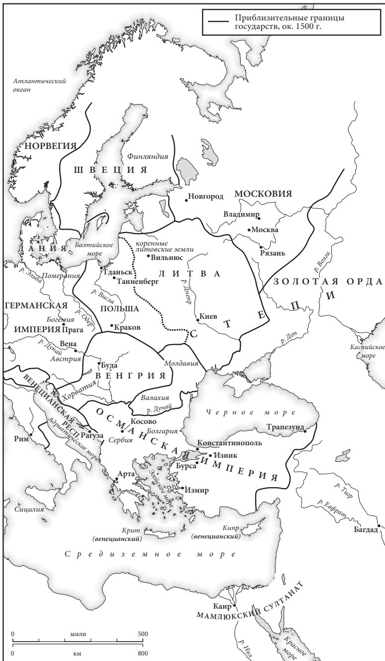
Карта 7. Восточная Европа в 1500 г.