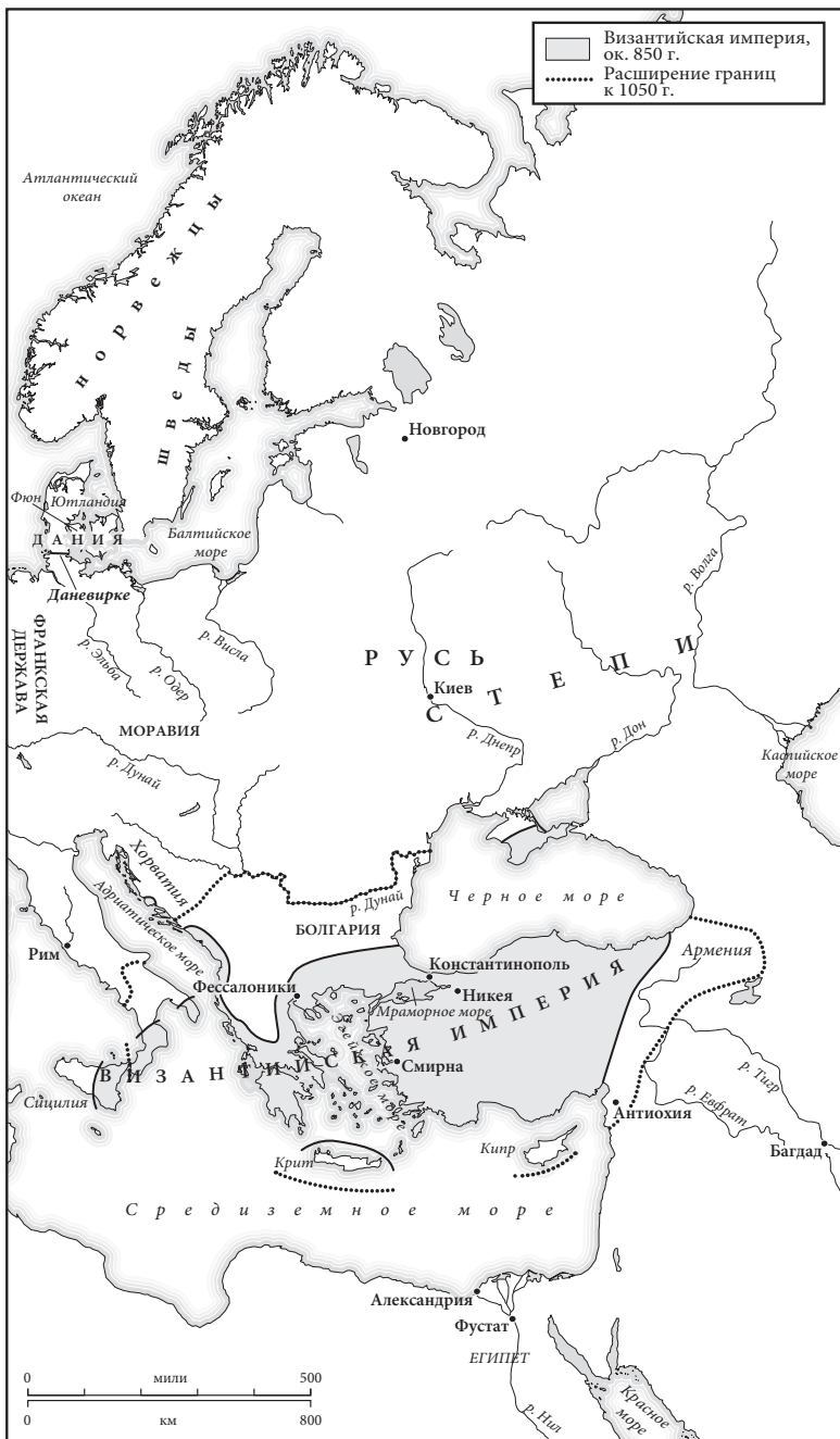
Карта 3. Восточная Европа в 850 г.