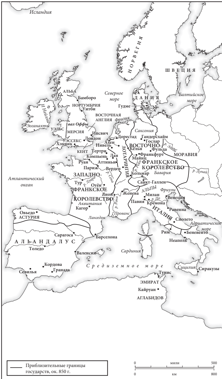
Карта 2. Западная Европа в 850 г.