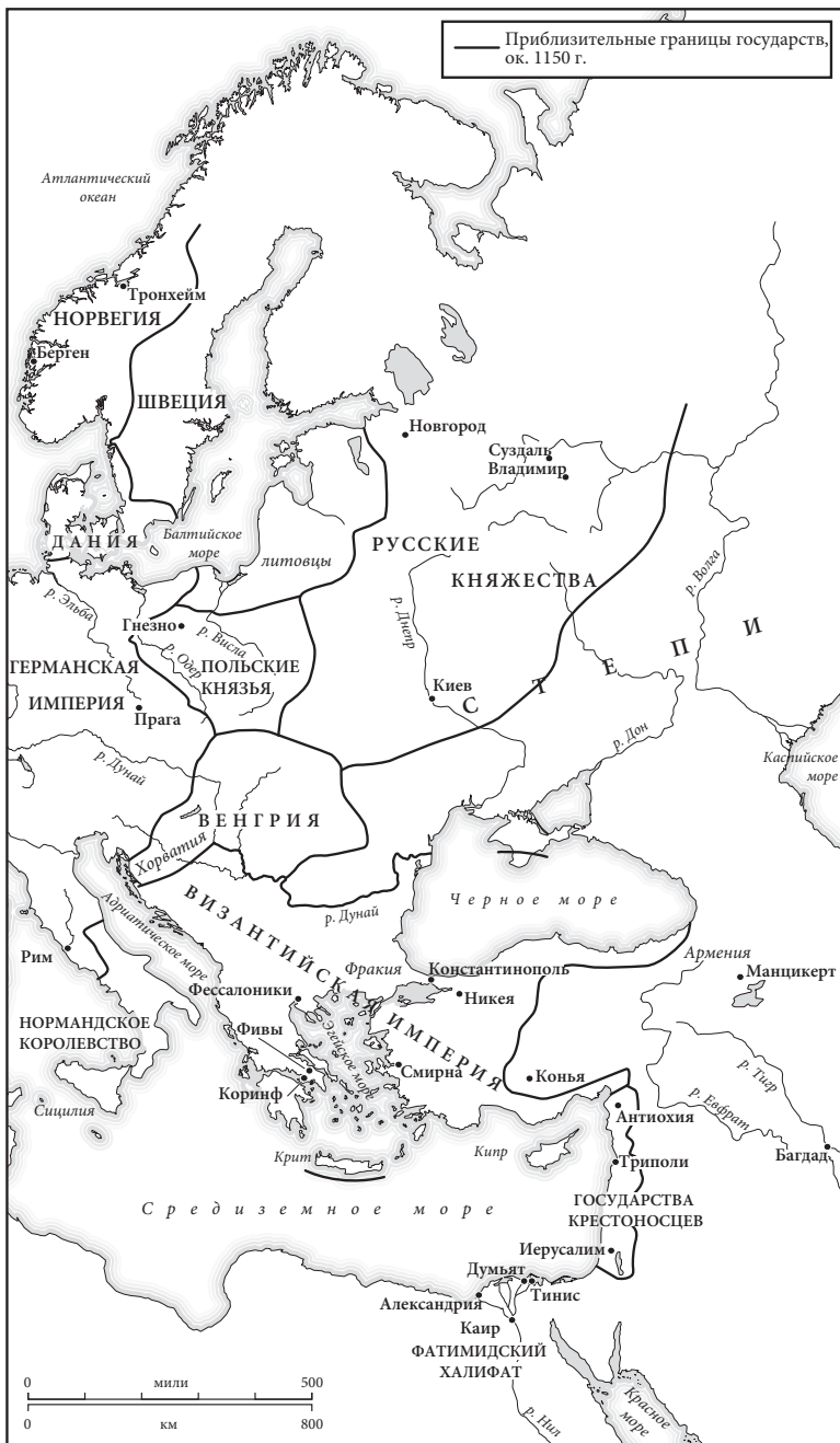
Карта 5. Восточная Европа в 1150 г.