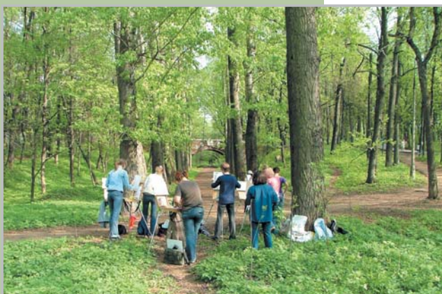
Фотография, сделанная во время этюдов.

1. Контуры должны наноситься легко, с небольшим нажимом. В этой картине нажим на карандаш был большим, чем положено, для наглядности иллюстрации.