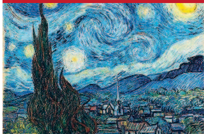
VINCENT VAN GOGH

Тейт Британия (с. 56) проведет крупнейшую выставку работ голландского художника за прошедшее десятилетие. На выставке будут рассмотрены отношения Ван Гога с Британией – идеи, которые повлияли на его творчество, и его идеи, вдохновившие других художников.