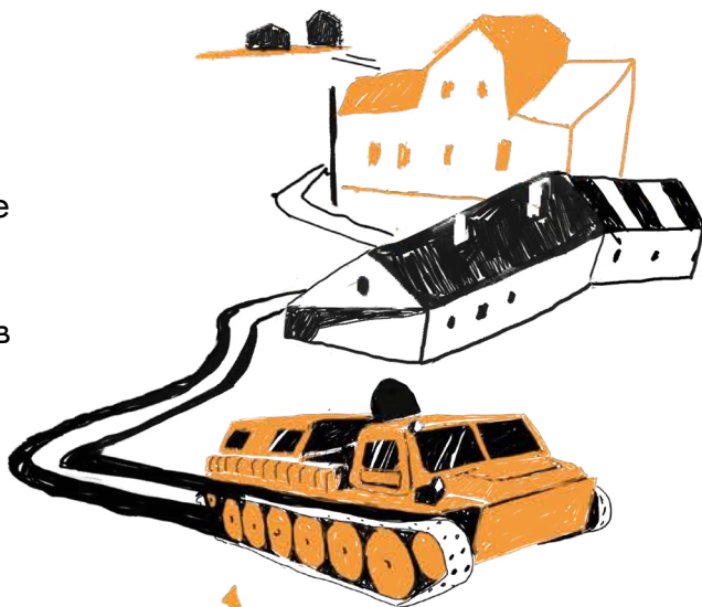
↑ ГУСЕНИЧНЫЙ ВЕЗДЕХОД