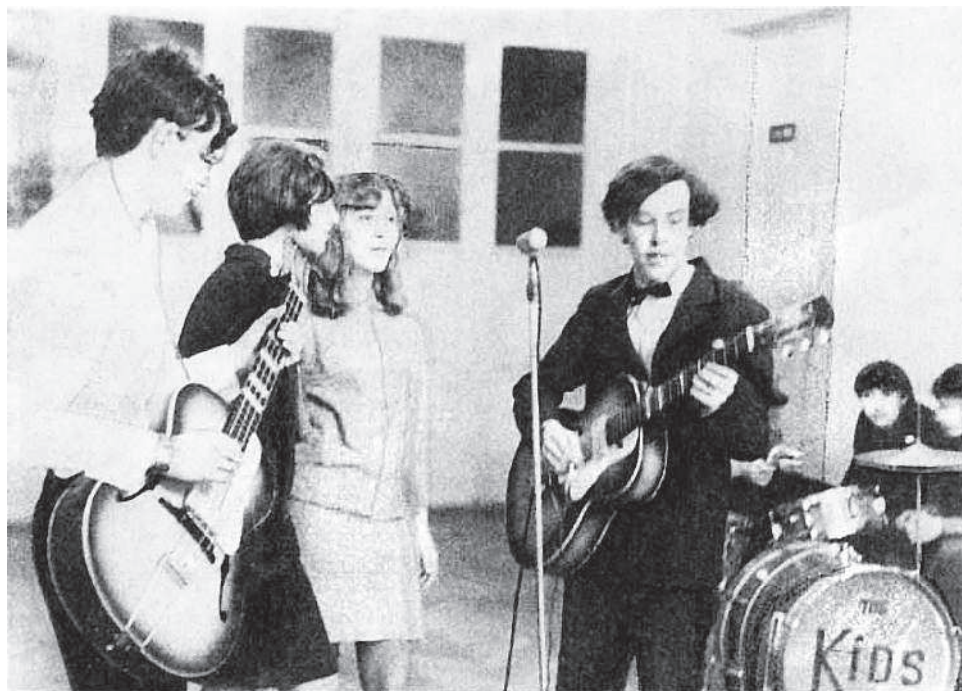
«У Макаревича были две девочки. Они пели песни протеста на английском языке»