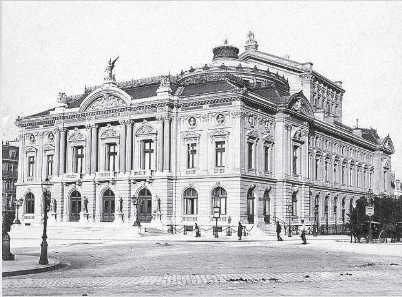
Большой театр Женевы (Швейцария). О. Гарцини. 1884—94 гг.

боится убытка, не пожелает ли оно печатать драму в типографии «Нового времени», где на нашем счету лежит около 150 руб., которые могут войти в покрытие расходов по изданию? Свою книгу я бы думал издать только экземплярах в 500 (?); для драмы также, думаем, достаточно это число.