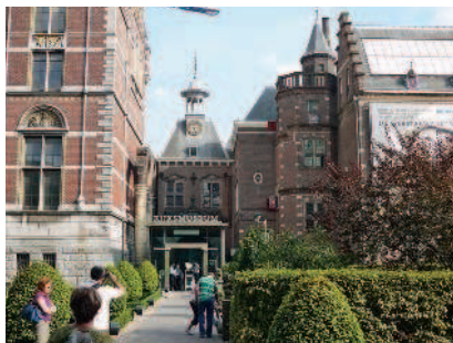
Вход в Рейксмузеум

Вечер. Загляните в расположенный рядом великолепный Концертный зал (▷82), чтобы посвятить вечер классической музыке, или забудьте об осторожности и рискните в казино Holland Casino.