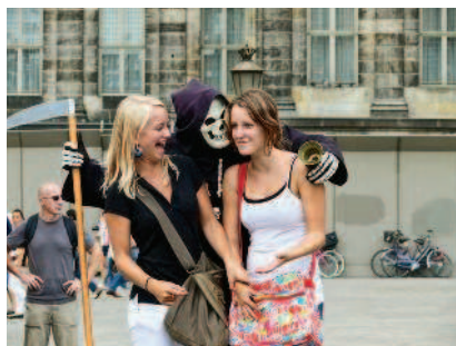
Улыбка смерти на площади Дам