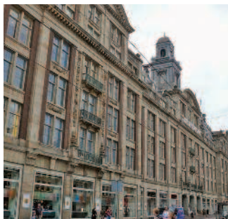
Универсам De Bijenkorf

Обед. Попробуйте роскошные блюда французской кухни в ресторане Café Roux, расположенном в отеле Grand на улице Oudezijds Voorburgwal. Менее дорогие блюда индонезийской кухни можно отведать в ресторане Sukasari на улице Damstraat.