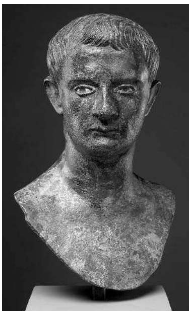
Бронзовый бюст императора Гая (Калигулы).