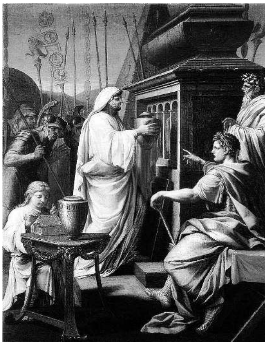
Эташ Лёсюёр. «Калигула помещает прах матери и брата в гробницу предков».