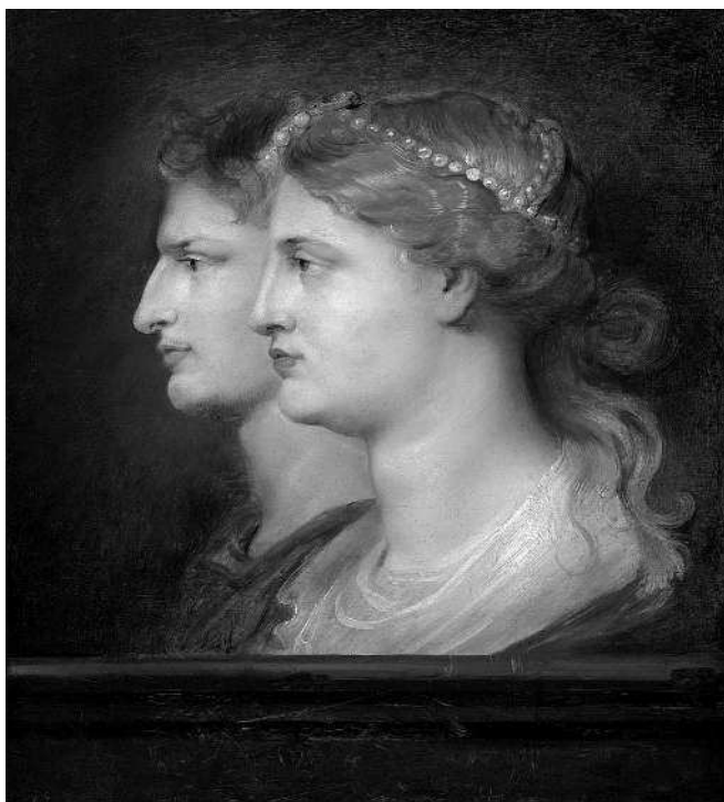
Питер Пауль Рубенс. Германик и Агриппина Старшая. 1614. Национальная галерея искусства, Вашингтон

нец, на радость народу, император стал устраивать развлечения. Если Тиберий славился прижимистостью и увеличивал государственную казну, то молодой император Калигула просто сорил деньгами, не жалея их на любимые народом пышные зрелища.