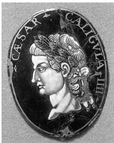
Император Калигула. Позолоченная эмаль. конец XVII — начало XVIII века. Метрополитен- музей, Нью-Йорк