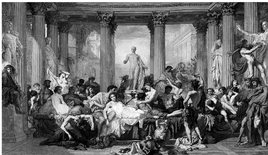
Тома Кутюр. Римляне времен упадка. 1847. Музей Орсе, Париж

Это было не единственное, что он позаимствовал у Востока. Его знаменитые кровосмесительные связи с сестрами (о чем так много сегодня написано) тоже вполне соответствовали традициям, например, египетской монархии. Фараоны нередко женились на собственных сестрах, и это считалось нормальным. Калигула же открыто обожал свою сестру Друзиллу, есть предположение, что он даже вступил с ней в брак. А когда она внезапно умерла совсем молодой, прика-