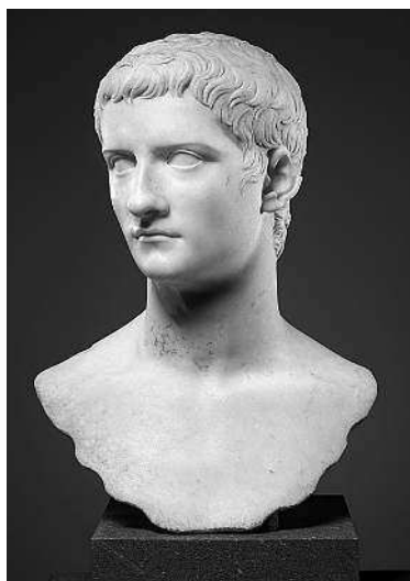
Мраморный бюст императора Гая, известного как «Калигула». 37–41 года. Метрополитен-музей, Нью-Йорк

Наконец (именно так пишут все римские историки) 16 марта 37 г. император Тиберий умер... или был убит в тот момент, когда, находясь при смерти, вдруг открыл глаза. Присутствовавшие очень испугались: если он останется жить, последуют новые казни! И тогда все- сильный фаворит префект претория (начальник стражи) Макрон приказал забросать умирающего императора одеждой, из-под которой тот не смог выбраться и в конце концов задохнулся. Есть и другая версия, которая гласит, что Тиберия при-