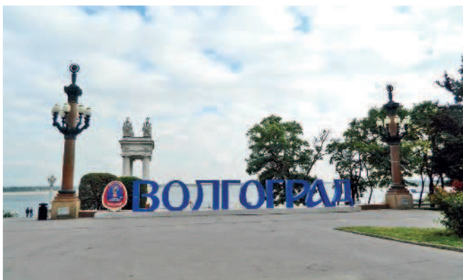
Волгоград в ожидании чемпионата мира