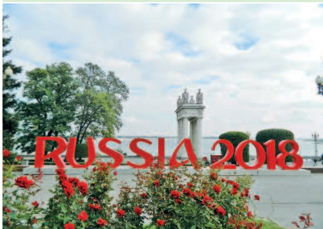
Волгоград в ожидании чемпионата мира

День второй. С раннего утра можно отправиться на Мамаев курган — именно в это время там можно бродить в относительном спокойствии. Уже с 9 часов утра на курган начинает стекаться масса народа, особенно в горячий туристический сезон. Кроме того, если вы приехали в Волгоград летом, именно раннее утро позволит вам избежать ужасающей жары и зноя на открытом пространстве. Полюбовавшись панорамой города, спуститесь с кургана обратно. Вы можете совершить прогулку мимо нового стадиона «Волгоград-Арена» и оказаться в парке «Дружба». Это хорошее место для отдыха, там