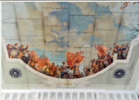
Панно на ж/д вокзале