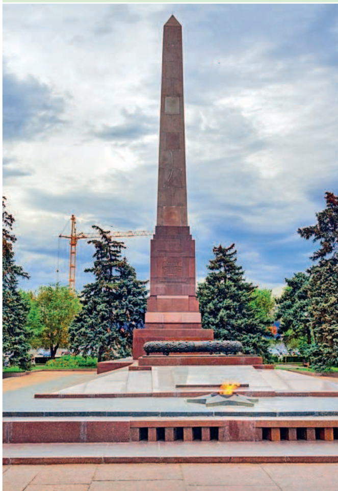
Площадь павших борцов

День первый. Знакомство с городом следует начать с его центра. Начинайте с площади Павших Борцов, пройдите далее по Аллее Героев на центральную набережную Волгограда. Перед вами откроются волжские просторы. Не спеша пройдите далее по набережной налево и завершите экскурсию по центру города посещением панорамы «Сталинградская битва», а также взгляните на разрушенную мельницу Гергардта и дом Павлова. Поднявшись на площадь