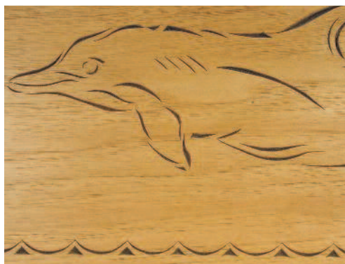
Дельфин, изящно изображенный в технике контурной резьбы

From Chip Carvers Workbook , by Dennis Moor, 2005, Fox Chapel Publishing, Inc.