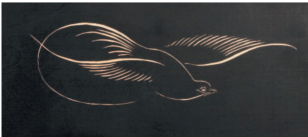
Контурная резьба. Липовая дощечка предварительно покрашена в черный цвет, а затем выполнена отчетливая контурная резьба с помощью стамески-уголка

Область применения: Декорирование мебели, изготовление клише для ксилографии, вырезание надписей