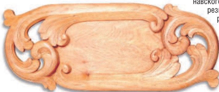
Carving courtesy Randy Kinnick