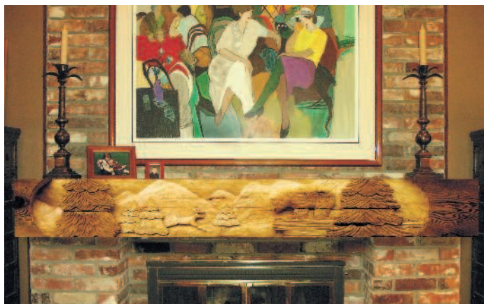
Превосходный пример рустикальной архитектурной резьбы Грега Янга из Германтауна, штат Висконсин