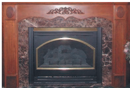
Архитектурная резьба. Эта резная рама из древесины вишни обрамляет камин. Ширина 2 м, высота 1 м. Спиралевидные формы типичны для архитектурной резьбы.