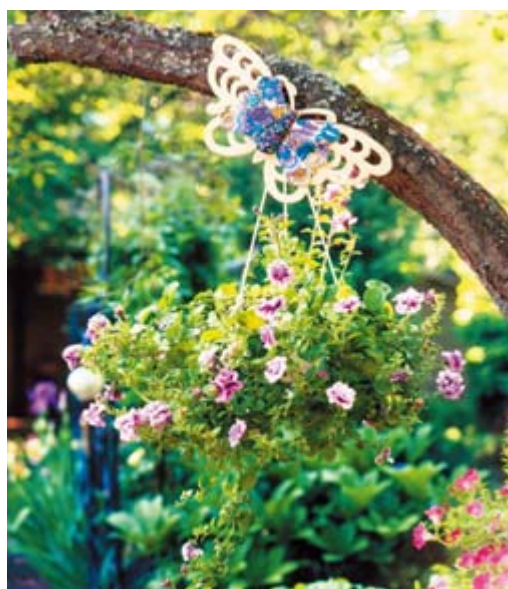
Рис. 29. Садовая композиция: бабочка и кашпо для цветов