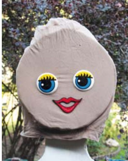
Рис. 206а. Голова местной красотки почти готова