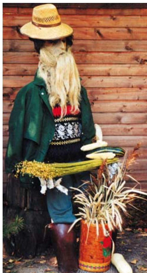
Рис. 207. Огородник с большим стажем