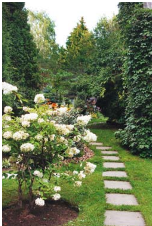
Рис. 2. Один из уголков когда-то неухоженного сада