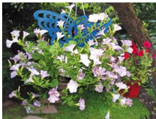
Рис. 28. Ажурная деревянная бабочка выкрашена масляной краской