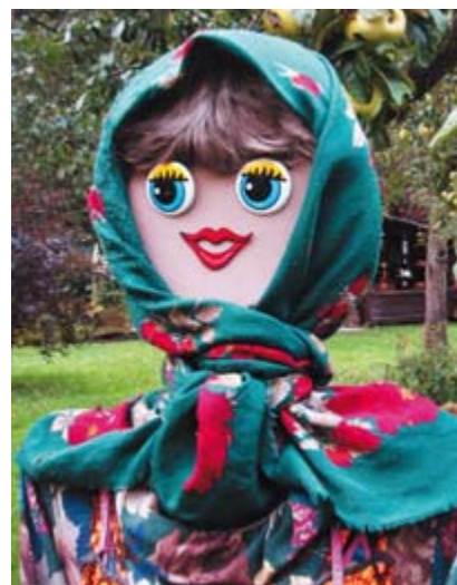
Рис. 206б. Платок и парик сделали молодую Садовницу неотразимой