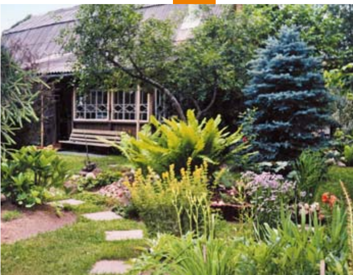
Рис. 1. Запущенный сад через 5–6 лет стал приобретать «человеческий» облик