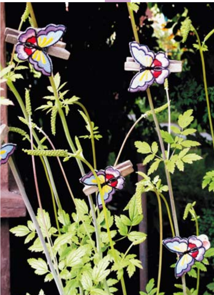
Рис. 17. Групповой портрет «Бабочки на прищепках». Изящные стебли и листья клопогона удачно дополнили композицию и сделали ее похожей на графический рисунок