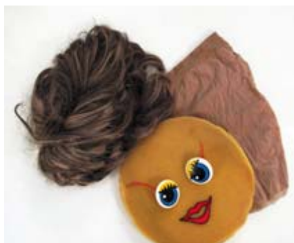
Рис. 205. Эти предметы нужны для головы Садовницы