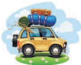
ба г аж