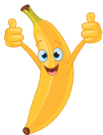
ба н ан