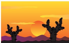
ба г ровый