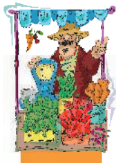
ба з ар