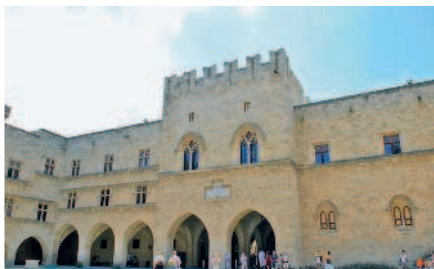
Дворец Великого магистра

Вечер. Подкрепившись, вечером продолжите прогулку по освещенным средневековым улочкам Старого города. Прогуляйтесь по здешним лавкам традиционных греческих продуктов и бутикам кожаных изделий.