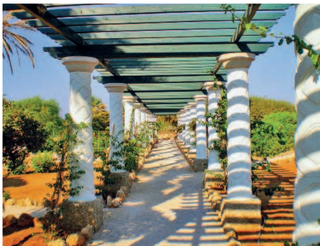
Дорога к термам на курорте Калифея