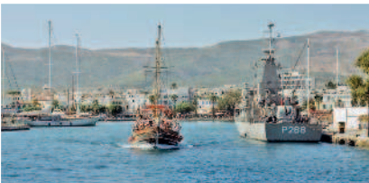
Остров Кос. Гавань