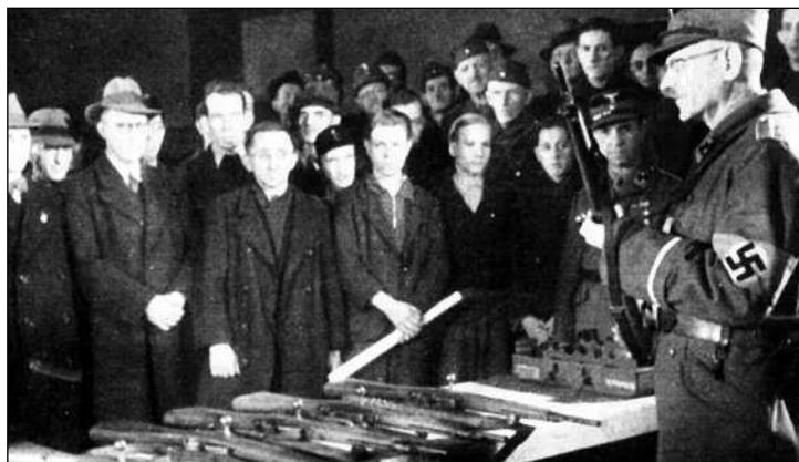
Обучение фольксштурмистов. Этим людям в очках и шляпах завтра предстояло выдержать удары советских танков. Преподаватель в повязке со свастикой символизирует «партийное начало» в создании фольксштурма

ных в фольксштурм расплылись между мелкими частями численностью до батальона. Даже попытки вооружать батальоны фольксштурма артиллерией не изменяли общей тенденции размазывания их тонким слоем по всей территории Германии. При этом сама жизнь заставляла использовать фольксштурмистов для восполнения потерь соединений вермахта.