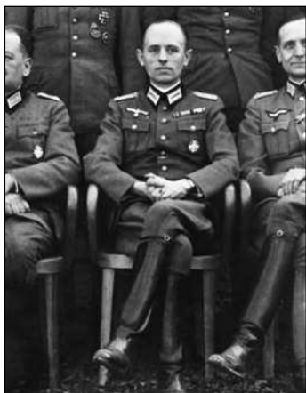
Руководитель Отдела изучения армий Востока (ОКН/ФНО) германского Генерального штаба Рейнхард Гелен (в центре)

«Поскольку давно ожидаемое зимнее наступление советских войск между Карпатами и Мемелем пока не началось, возник вопрос о том, изменились ли советские планы в целом и собирается ли советское командование, используя успехи в полосе ГА «Юг», перенести центр тяжести операций в Венгрию, отказавшись от действий против ГА «А» и «Центр»?»