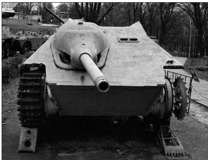
САУ «Хетцер» в экспозиции Музея Войска Польского в Варшаве. Самоходка принадлежала предположительно 73-й пехотной дивизии и была взорвана экипажем при отходе

фланге 4-й ТА сосредотачивается 13-я А в составе 8 сд и 1 кд, на левом фланге в районе восточнее Столпницы 5-я гв. А в составе 7 сд и 2 кд. Позади 4-й ТА западнее Вислы концентрируется 1-я гв. ТА. Русские планируют начать свое наступление с короткого, но очень сосредоточенного огня большого количества артиллерии». В качестве армии М.Е.Катукова (1-я гв.ТА) скорее всего была опознана 3-я гв.ТА П.С.Рыбалко.