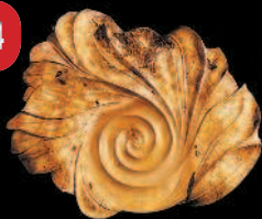
Настенное панно «Спираль жизни»