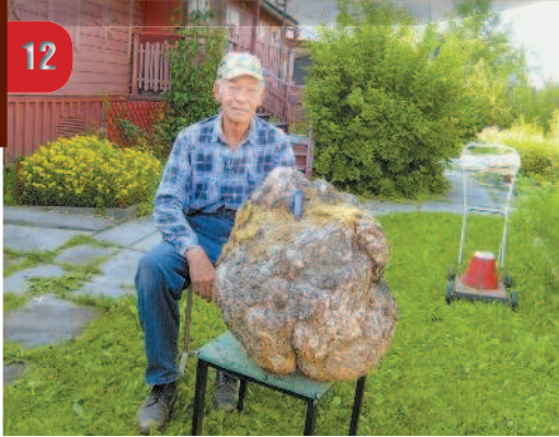
Сувель из отходов лесотилки