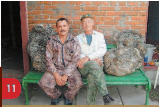
Новые «презенты» от лесника