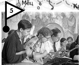
«Русская» Франция .....стр. 101