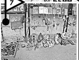
À propos .....стр. 191