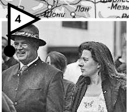
Французы «настоящие» и французы «как бы» стр. 83