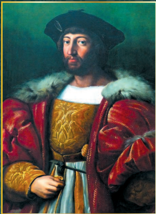
Портрет Лоренцо деи Медичи. Рафаэль Санти (1483—1520).