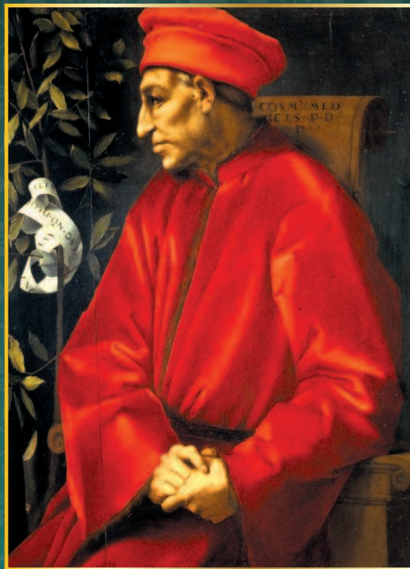
Портрет Козимо Старшего Медичи. Понтормо (1494—1557).

надо спуститься в долину, чтобы охватить взглядом холмы и горы, и подняться на гору, чтобы охватить взглядом долину, так и здесь: чтобы постигнуть сущность народа, надо быть государем, а чтобы постигнуть природу государей, надо принадлежать к народу.