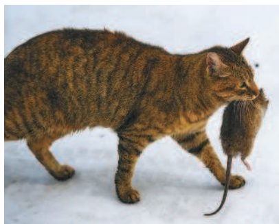
Кошки стали ловить грызунов, которые уничтожали урожай