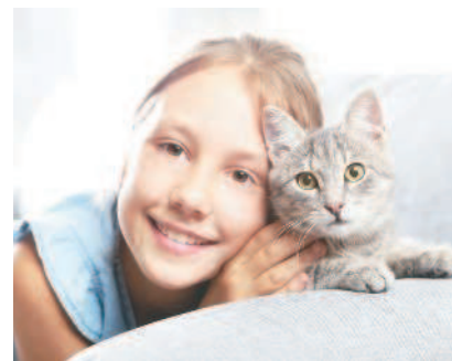
Человек подружился с кошкой и разрешил ей жить в своём доме