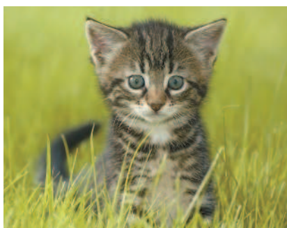
Кошки были одомашнены около 10 тысяч лет назад, когда люди начали засеять поля