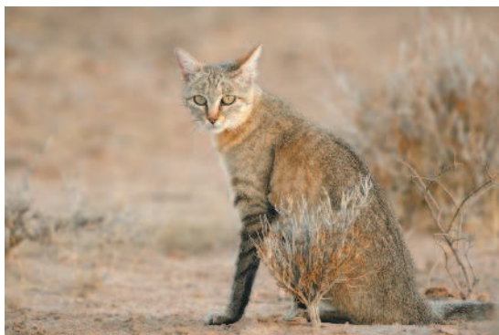
Предок домашних кошек — степной кот