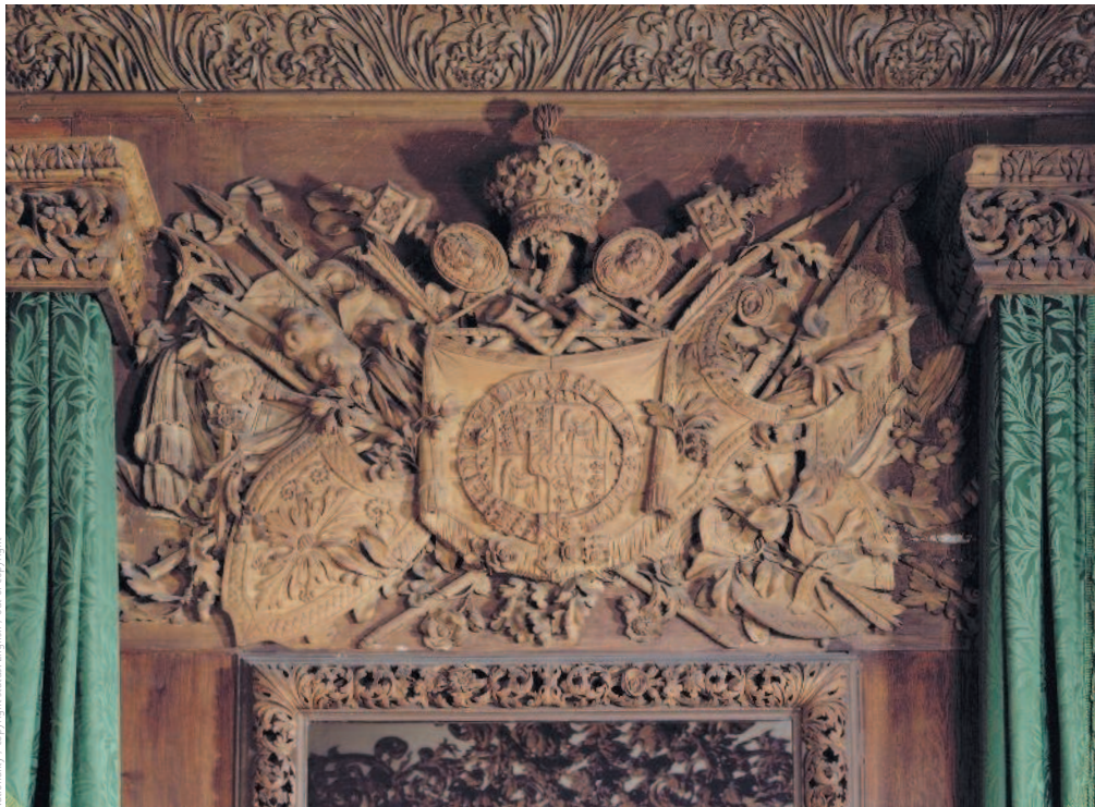
Герб 6-го герцога Сомерсета, вырезанный из липы Гринлингом Гиббонсом (1648—1721). Резьба была частью орнамента на Петорут-хаус в Сассексе, Соединенное Королевство

В XVIII веке миграция выросла с нескольких сотен до миллионов переселенцев, и в Северную Америку переехали некоторые из лучших резчиков по дереву из Европы и Скандинавских стран. Этот приток талантов