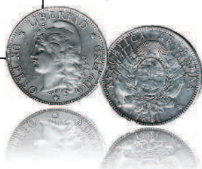
1 песо, 1881 г.

На аверсе ранних аргентинских монет чаще всего изображалась женщина во фригийском колпаке (символ свободы), на реверсе — герб или указание номинала.