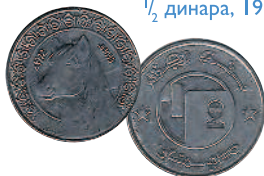
\frac{1}{2} динара, 1992 г.