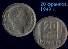
20 франков, 1949 г.

Портрет Марианны (типичный элемент оформления аверса французских монет — портрет женщины, символа Французской республики) на аверсе, номинал и год чеканки на реверсе.