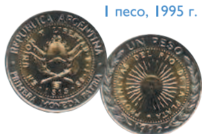
1 песо, 1995 г.

Монеты 1990-х гг. чеканились в основном из алюминиевой бронзы.