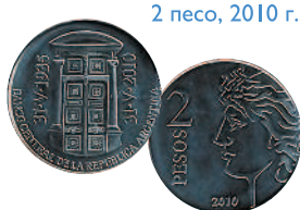
2 песо, 2010 г.

Монеты 1990-х гг. чеканились в основном из алюминиевой бронзы.