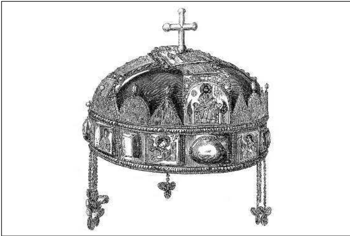
Корона венгерских королей