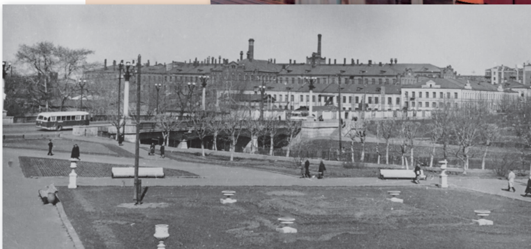
Вверху Вид на Большую Ивановскую мануфактуру. Архивное фото.

дракой. Я всегда стремился к красоте, чувствовал потребность создать женский образ, передать связанные с ним чувства и эмоции.