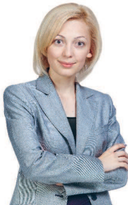
ОЛЬГА ТИМОФЕЕВА Председатель Комитета Государственной Думы ФС РФ по экологии и охране окружающей среды

Выпуск этой книги приурочен к Году экологии и особо охраняемых природных территорий, каким был объявлен 2017 год. От имени Комитета Государственной Думы по экологии и охране окружающей среды хочу выразить надежду, что тематический год дал толчок для многих успешных экологических проектов и, главное — для укрепления экологического сознания в каждом из нас.