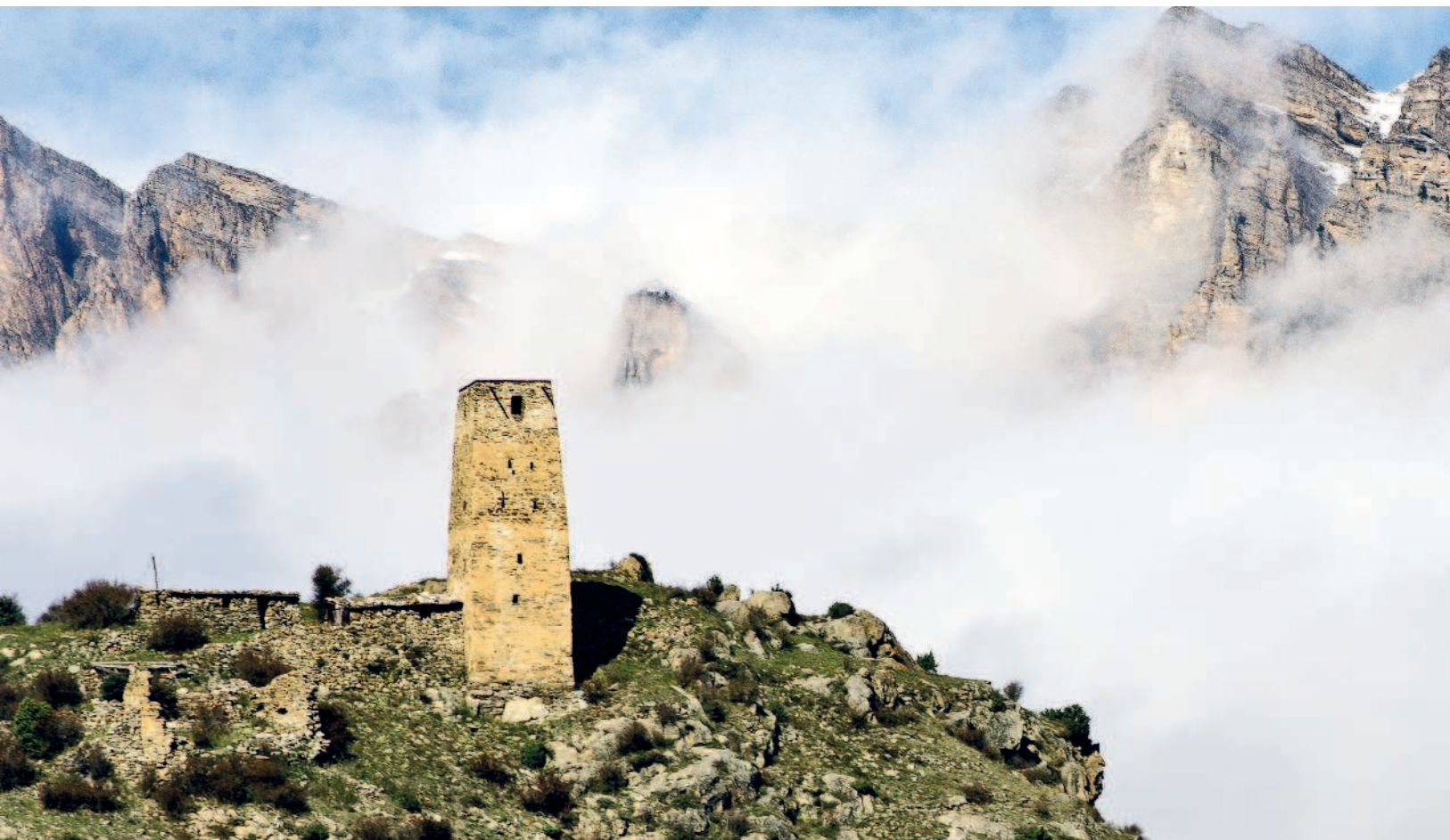
СТОРОЖЕВАЯ БАШНЯ РОДА АБИСАЛОВЫХ В СЕЛЕ МАХЧЕСК НА ТЕРРИТОРИИ НАЦИОНАЛЬНОГО ПАРКА. ВЫСОТА ПЯТИЯРУСНОЙ БАШНИ ПОЧТИ 30 МЕТРОВ — ВСЯ ОКРУГА ПРОСМАТРИВАЕТСЯ НА МНОГИЕ КИЛОМЕТРЫ