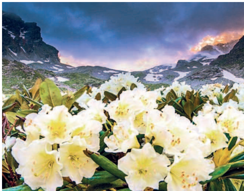
РОДОДЕНДРОН КАВКАЗСКИЙ РАСПРОСТРАНЕН НА ВЫСОКОГОРЬЯХ КАВКАЗА, ОСОБЕННО МНОГО ЕГО НА ВЫСОТЕ 1500–3000 МЕТРОВ НАД УРОВНЕМ МОРЯ

Еще один вариант проезда — самолетом до аэропорта Минеральные Воды, затем автобусом до Владикавказа, а далее до селения Чикола. Есть большая вероятность, что путешествовать придется под дождем или в тумане, что в горах хуже дождя. А значит, стоит запастись теплой одеждой — в горах холодно даже летом.