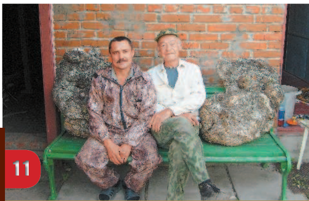
Сувель из отходов лесопилки