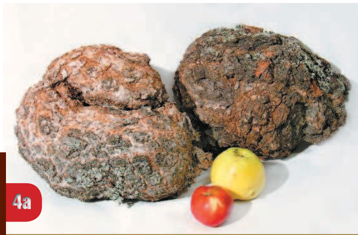
Наросты с корой: а — свежесрезанный березовый сувель; б — пробуждение каповых позек

ная обработка изделия — с помощью бормашины; приходится пользоваться и самостоятельно изготовленными инструментами. Это различные шарошки на пробках, грибки из наждачной бумаги, шлифовальные приспособления на основе саморезов, инструменты на коже и ковролине и др. Получается под свою руку и дешевле.