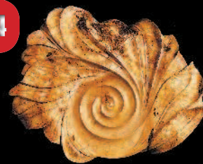
Настенное панно «Спираль жизни»