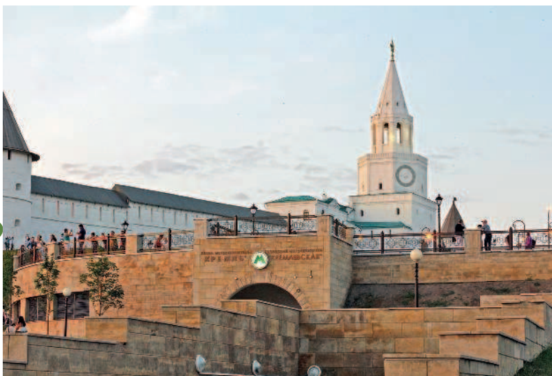
Станция метро «Кремлевская»

цитадель была обнесена дубовыми стенами с несколькими каменными участками; полностью же каменной она стала в XVI — начале XVII века после завоевания Казани Иваном Грозным. Примечательно, что главными архитекторами нового белокаменного Кремля стали Постник Яковлев и Иван Ширяй — те самые псковские зодчие, что возводили храм Василия Блаженного в Москве. После архитектурный ансамбль Казанского кремля обзаводился новыми строениями, переделывался в угоду модным течениям и даже вновь стал действующей крепостью во время Пугачевского восстания. Ну а в бурном и беспощадном XX веке Казанский кремль, увы, утратил несколько выдающихся строений, успел обзавестись знаковыми объектами и на рубеже тысячелетий стал объектом Всемирного наследия ЮНЕСКО.