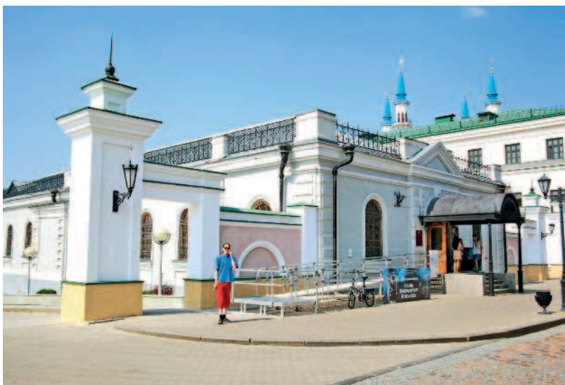
Выставочный зал «Манеж»

и Юнкерское училище, как только они замечают манящие минареты мечети Кул-Шариф. Но я все же настоятельно рекомендую вам посетить хотя бы один из музеев этого