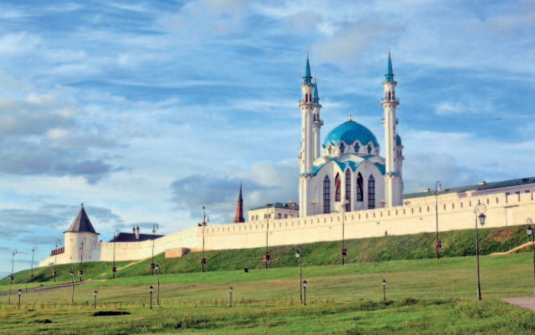
Белокаменные стены Кремля и мечеть Кул-Шариф

шего Казань, так и для того, кто уже знаком со столицей Татарстана. Тем более что наша сегодняшняя прогулка будет посвящена захватывающей теме, а именно — тайным символам и знакам в истории тысячелетнего города (поклонники «Кода да Винчи», вы уже собрались?). Зачастую эти символы выглядят вполне обычными элементами декора, хотя исследователям они представляются настоящими кодами истории. Хотите разгадать их? Тогда приступим.