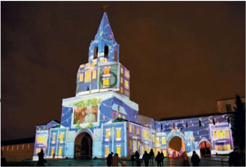
Мэппинг-шоу в Кремле

проезд сделали более широким и удобным, а в 1963 году третий ярус башни украсили часы с «малиновым» звоном. В том же году произошло еще одно важное изменение: над башней появилась позолоченная пятиконечная звезда диаметром около 3 метров. До революции над шатром башни возвышался имперский двуглавый орел, которого в советское время, разумеется, признали идеологически неверным. На смену ему и пришла звезда — первый из символов, встретившийся на нашем пути. Давайте остановимся на ней подробнее.