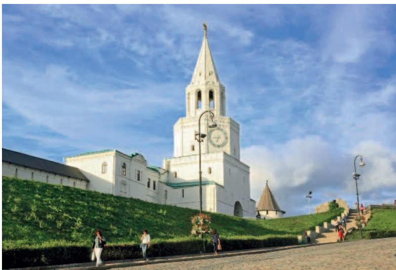
Спасская башня — парадные ворота Кремля

Покончив с историей, перейдем к осмотру древней цитадели. Как вы уже, наверное, знаете, Казанский кремль белокаменный, благодаря чему он очень эффектно смотрится и летом, и зимой (и является одной из самых фотогеничных крепостей России). По поводу цвета существует даже известная шутка: «Почему в Казани Кремль белый? Потому что ему краснеть не за что!»