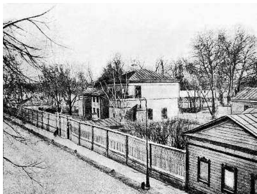
Дом-усадьба А.Н. Толстого в Большом Хамовническом переулке