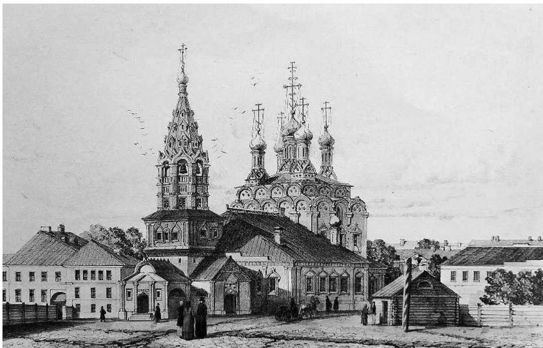
Церковь Вознесения (храм Николы в Хамовниках). 1842 г. Литография А. Дюрана