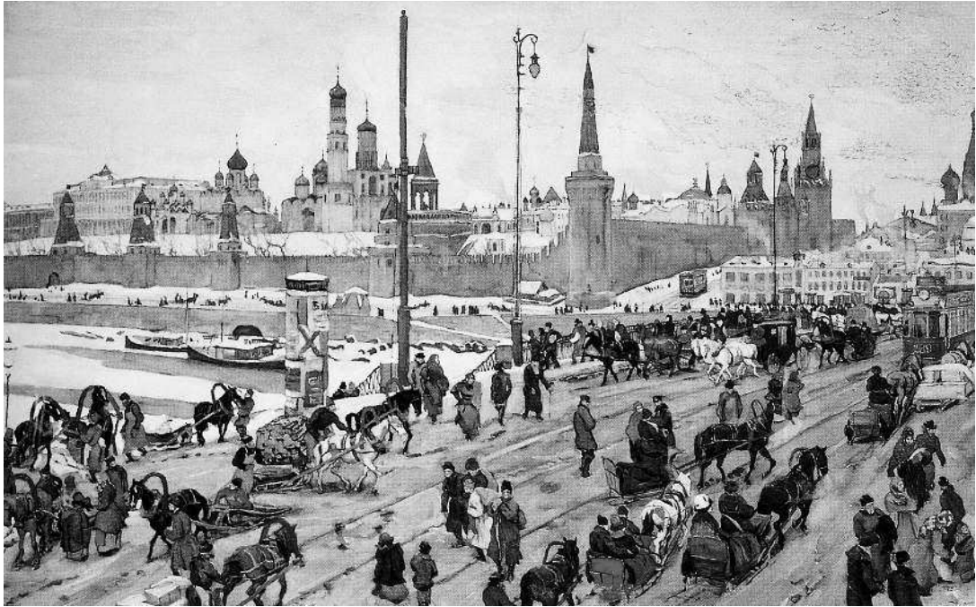
К.Ф. Юон. Москворецкий мост. Старая Москва. 1911 г.

Вдали два раза ударил колокол — два часа! — Это на Басманной. А это Ольховцы... — пояснил вожатый. И вдруг запел петухом: — Ку-ка-ре-ку!..