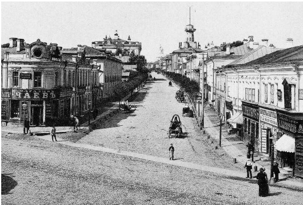
Вид Новой Басманной улицы от Разгуляя. 1888 г. Фотогравюра фирмы «Шерер, Набгольц и К о »

— Это Разгуляй, а это дом колдуна Брюса, — пояснил Костя. Так меня встретила в первый раз Москва в октябре 1873 года.