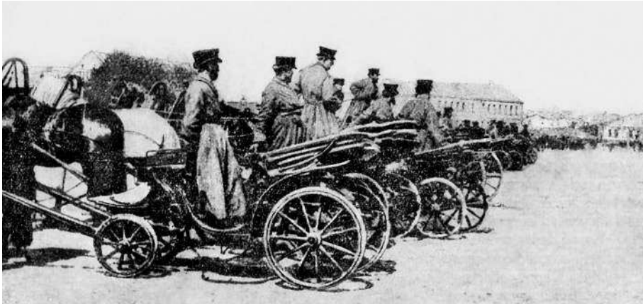
Московские извозчики на бирже. Фотография 1900-х гг.

Переезжаем Садовую. У Земляного вала — вдруг суматоха. По всем улицам извозчики, кучера, ломовики нахлестывают лошадей и жмутся к самым тротуарам. Мой возница остановился на углу Садовой.