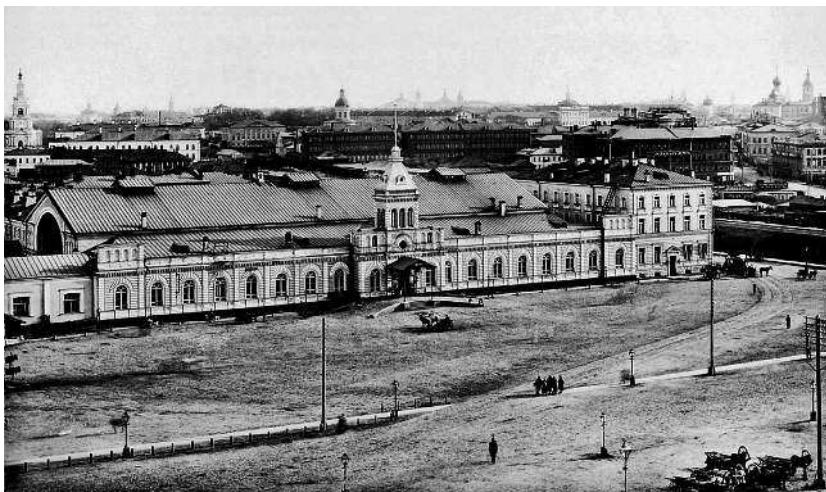
Вокзал Московско- Рязанской ж.д. 1888 г. (На месте этого здания было построено новое ныне существующее здание Казанского вокзала)

Вдали два раза ударил колокол — два часа! — Это на Басманной. А это Ольховцы... — пояснил вожатый. И вдруг запел петухом: — Ку-ка-ре-ку!..