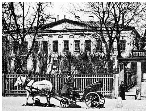
Уездная земская управа на Садовой-Сухаревской. Начало XX в.