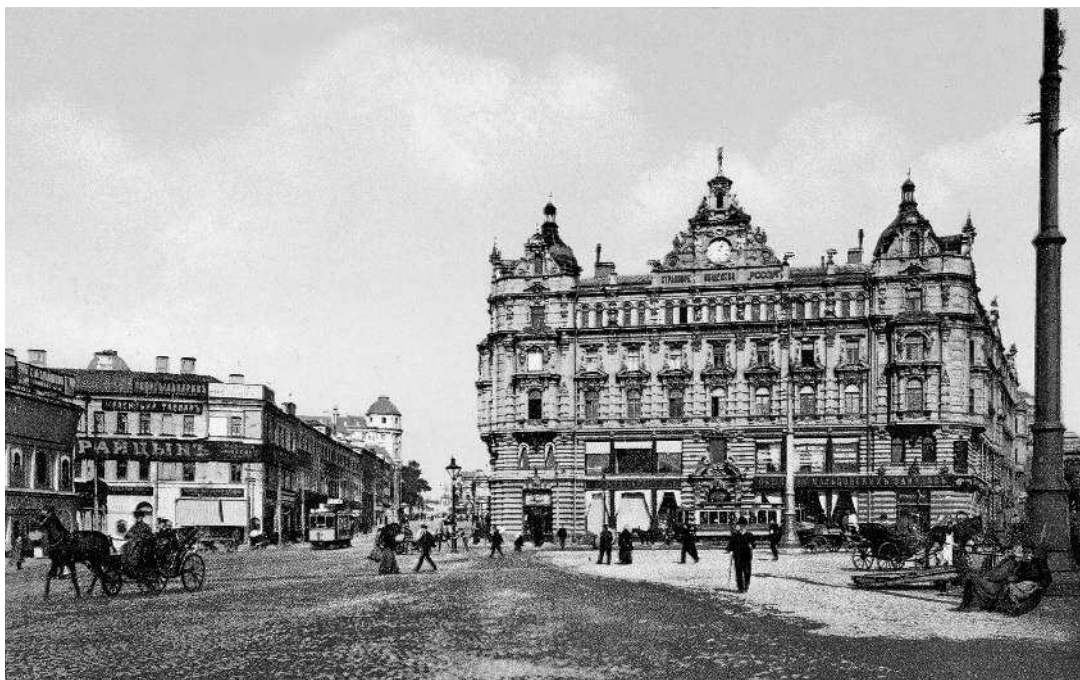
Дом страхового общества «Россия» на Лубянской площади. 1910 г.

— В Сибирь на каторгу везут: это — которые супротив царя идут, — пояснил полушепотом старик, оборачиваясь и наклоняясь ко мне.