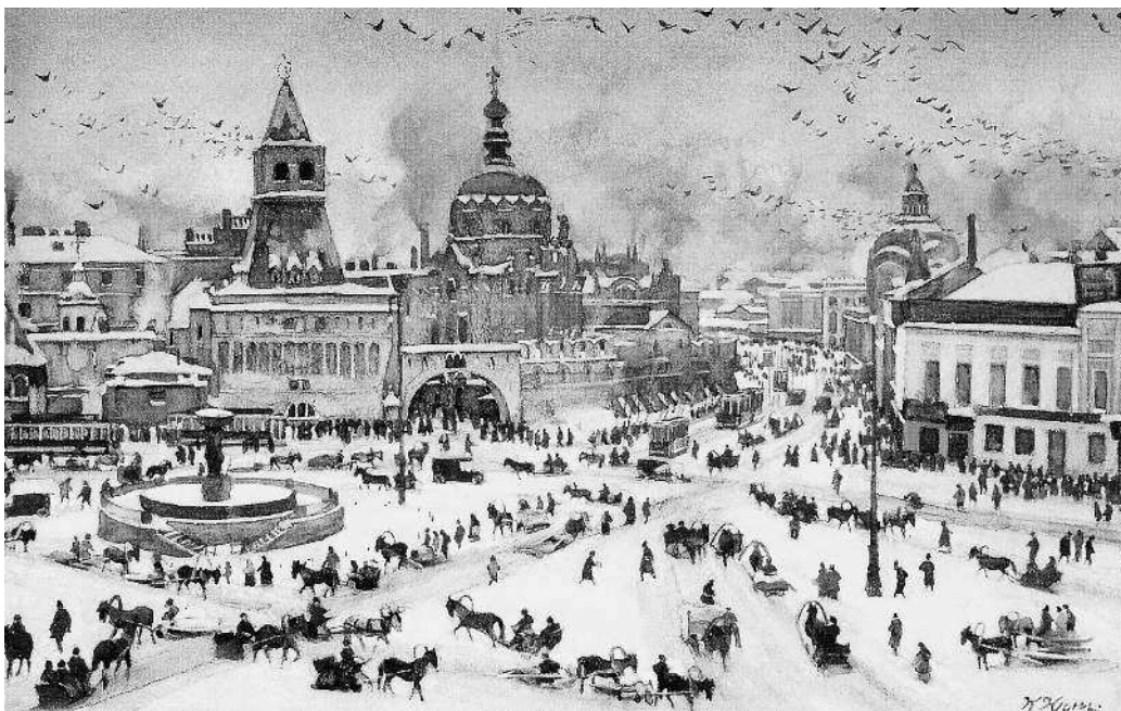
К.Ф. Юон. Лубянская площадь зимой. 1905 г.

Когда-то на месте этой каменной лестницы, на Болоте, против Кремля, стояла на шесте голова Степана Разина, казненного здесь. Там, где недавно,