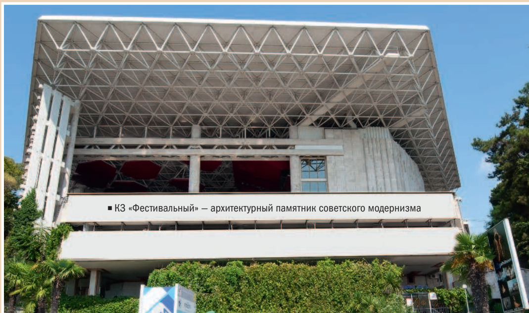
■ КЗ «Фестивальный» — архитектурный памятник советского модернизма

вального» выступали Ф. Киркоров, Валерия, С. Михайлов, С. Трофимов, Д. Билан, И. Кобзон, В. Леонтьев, И. Аллегрова, К. Орбакайте, Е. Шифрин и другие звезды.