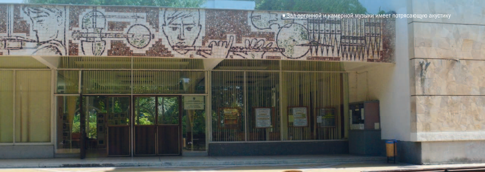
■ Зал органной и камерной музыки имеет потрясающую акустику

В 2005 г. Зал получил имя А. Ф. Дебольской — удивительной женщины, которая возглавляла эту площадку на протяжении 12 лет. Каждое лето здесь проходит Международный фестиваль органной музыки, на котором выступают лучшие органисты мира.