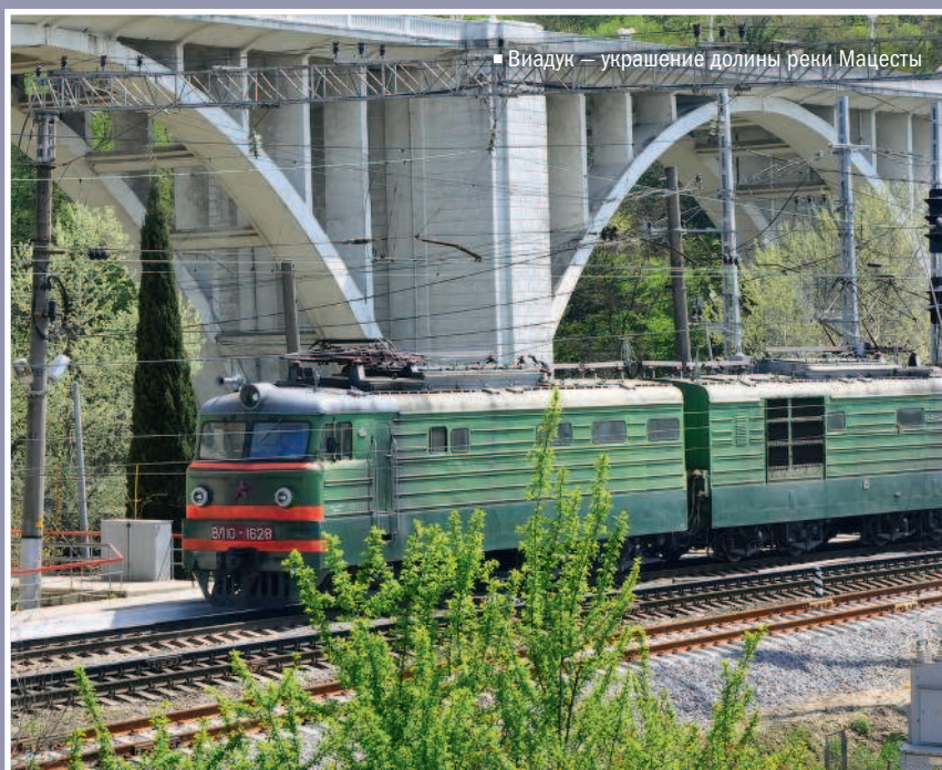
■ Виадук — украшение долины реки Мацесты

Мацестинский мост был построен в 1938 г. как часть автомобильной дороги, связывающей Новороссийск, Сочи и Сухум. Он соединяет берега Мацесты и является участком федеральной трассы Джубга — Адлер. Работая над проектом виадука, архитекторы-академики В. Шуко, В. Гельфрейх и А. Хряков ставили перед собой цель создать не просто функциональный мост, а гармоничный элемент речной долины, подчеркивающий ее красоту. Длина пятипролетного арочного сооружения составляет 411 м, ширина — 18 м, высота — 31 м. При этом мост не кажется массивным. Обилие ажурных элементов, многочисленные балюстрады и фонари, а также теплый светло-бежевый окрас придают ему легкость, изящество и некую воздушность. Сооружение украшено выступающими балконами, с которых