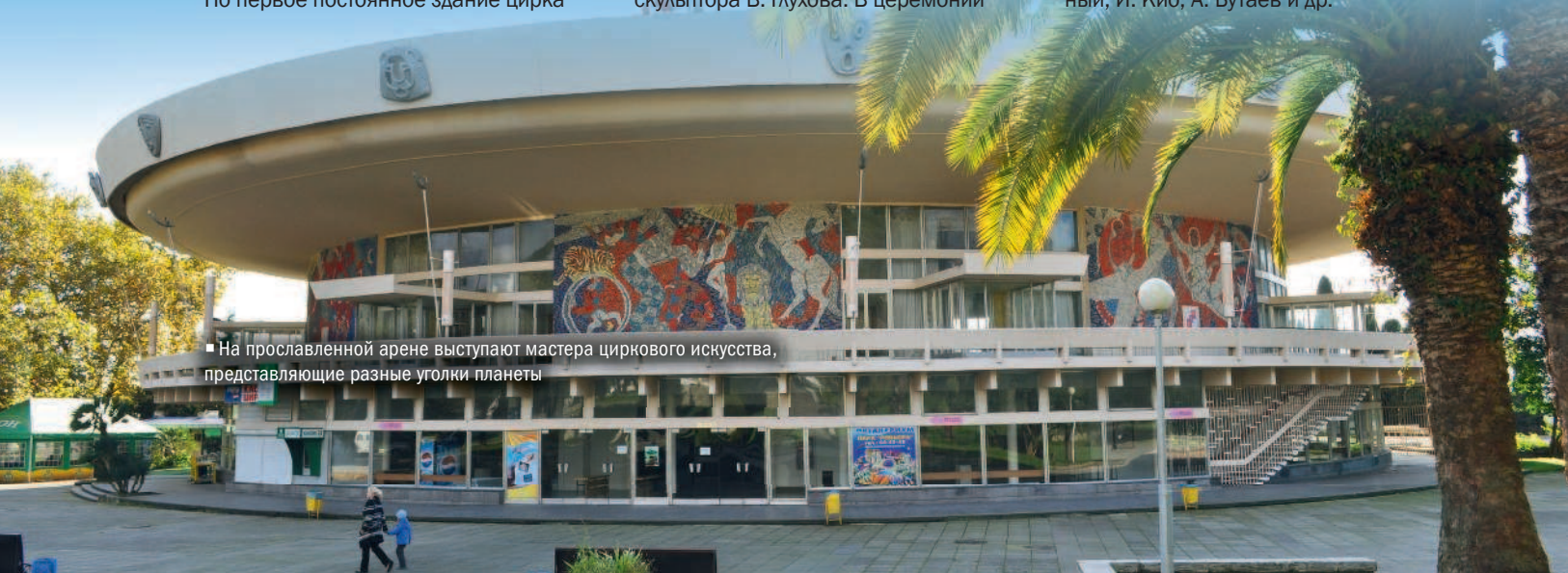
■ На прославленной арене выступают мастера циркового искусства, представляющие разные уголки планеты