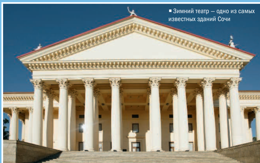
■ Зимний театр — одно из самых известных зданий Сочи