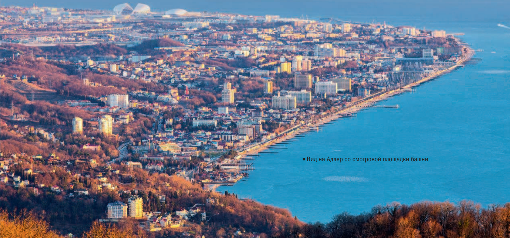
■ Вид на Адлер со смотровой площадки башни