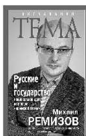
Михаил Ремизов Русские и государство. Национальная идея до и после «крымской весны»