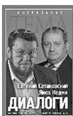
Евгений Сатановский Яков Кедми ДИАЛОГИ