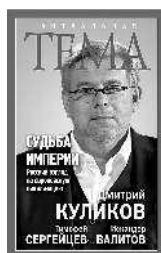
Дмитрий Куликов Судьба империи. Русский взгляд на европейскую цивилизацию