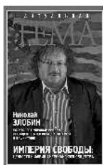
Николай Злобин Империя свободы: ценности и фобии американского общества