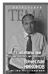
Вячеслав Никонов Код цивилизации. Что ждёт Россию в мире будущего?

Интернет-магазины издательства: https://book24.ru , http://www.labyrinth.ru/ В электронном виде книги издательства вы можете купить на www.litres.ru