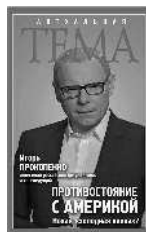
Игорь Прокопенко Противостояние с Америкой. Новая «холодная война»?