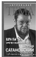
Евгений Сатановский Шла бы ты... Заметки о национальной идее