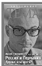
Армен Гаспарян Россия и Германия. Друзья или враги?