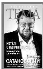
Евгений Сатановский Котёл с неприятностями. Ближний Восток для «чайников»