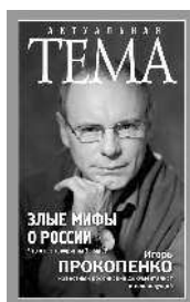
Игорь Прокопенко Злые мифы о России