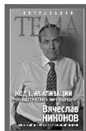
Вячеслав Никонов Код цивилизации. Что ждёт Россию в мире будущего?

Интернет-магазины издательства: https://book24.ru , http://www.labirint.ru/ В электронном виде книги издательства вы можете купить на www.litres.ru