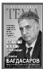
Семён Багдасаров Ближний Восток: вечный конфликт