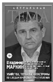
Владимир Маркин Убийства, теракты, катастрофы. По следам кровавых преступлений