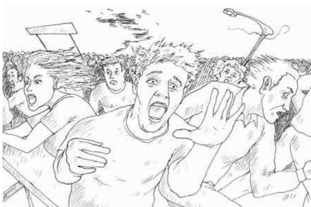
Бегающая толпа не менее опасна, чем взрыв гранаты