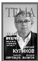
Дмитрий Куликов Судьба империи. Русский взгляд на европейскую цивилизацию