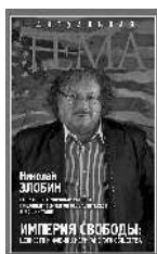
Николай Злобин Империя свободы: ценности и фобии американского общества