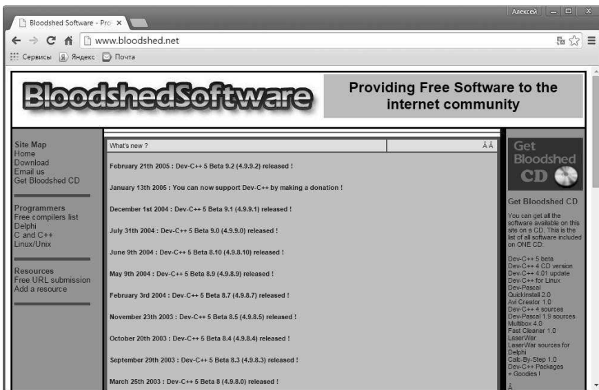
Рис. В.2. Окно браузера открыто на странице www.bloodshed.net

Среда разработки Dev-C++ может быть загружена со страницы www.bloodshed.net проекта BloodshedSoftware. На рис. В.2 показано окно браузера, открытое на данной странице.