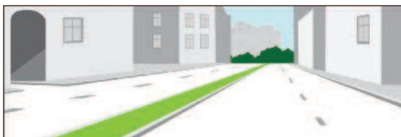
Разделительная полоса, разделяющая две проезжие части, выделена конструктивно

«Прицеп» — транспортное средство, не оборудованное двигателем и предназначенное для движения в составе с механи-