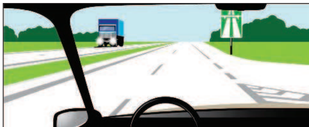
Автомагистраль обозначена знаком 5.1

« Автомагистраль » — дорога, обозначенная знаком 5.1** и имеющая для каждого направления движения проезжие части,