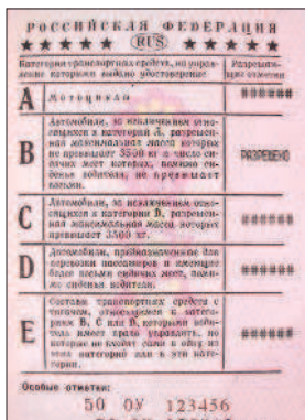
Водительские удостоверения действующие (выдача прекращена 1 марта 2011 г.)

регистрационные документы на данное транспортное средство (кроме мопедов), а при наличии прицепа — и на прицеп (кроме прицепов к мопедам);