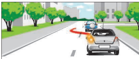
Обгон связан с выездом на полосу встречного движения

«Опасность для движения» — ситуация, возникшая в процессе дорожного движения, при которой продолжение движения