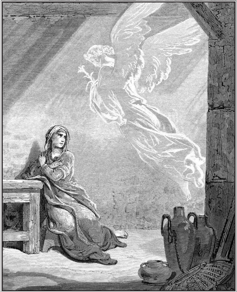
Гюстав Доре. Благовещение Девы Марии.