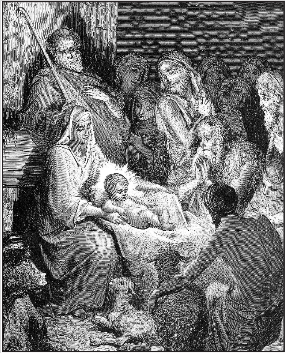
Гюстав Доре. Рождество Иисуса Христа.