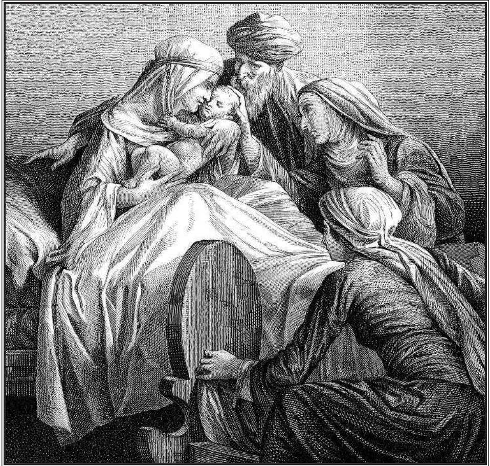
Александр Бидя. Рождение Иоанна Крестителя.