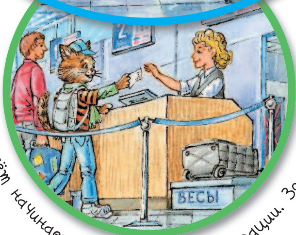
Полёт начинается у стойки регистрации. Здесь пассажир взвешивает и сдаёт багаж.

У каждого рейса есть свой номер, по которому мы можем определить, откуда именно будет произведён вылет. Посадка и высадка пассажиров осуществляется в определённом терминале. К какому терминалу подадут самолёт, и где мы сможем зарегистрироваться на свой рейс, нам подскажет информационное табло.