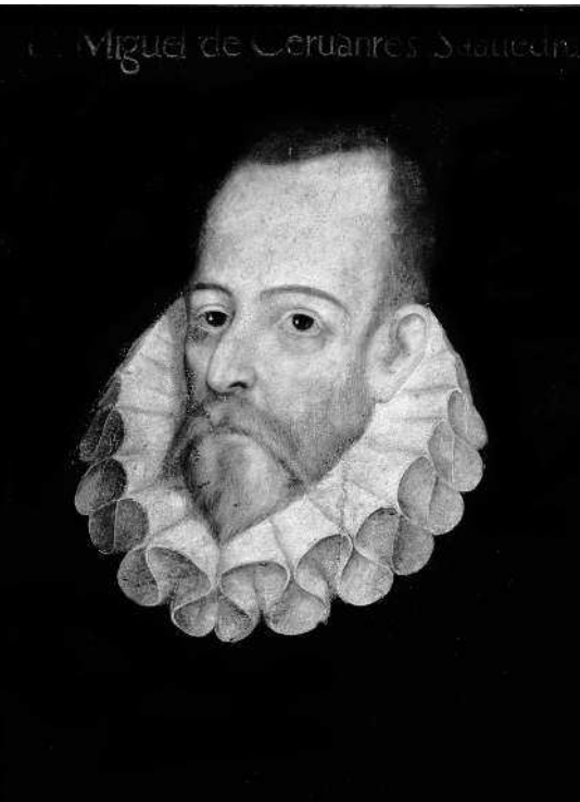
Хуан Мартинес де Хаурегу-и-Агилар. Предположительный портрет писателя Мигеля де Сервантеса. 1600. Королевская историче- ская библиотека, Мадрид.