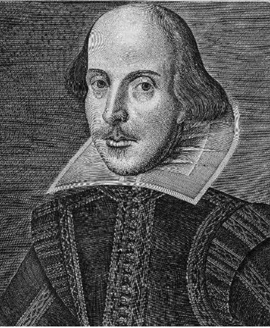
Мартин Друшаут. Единственный извест- ный портрет Уильяма Шекспира. 1623.