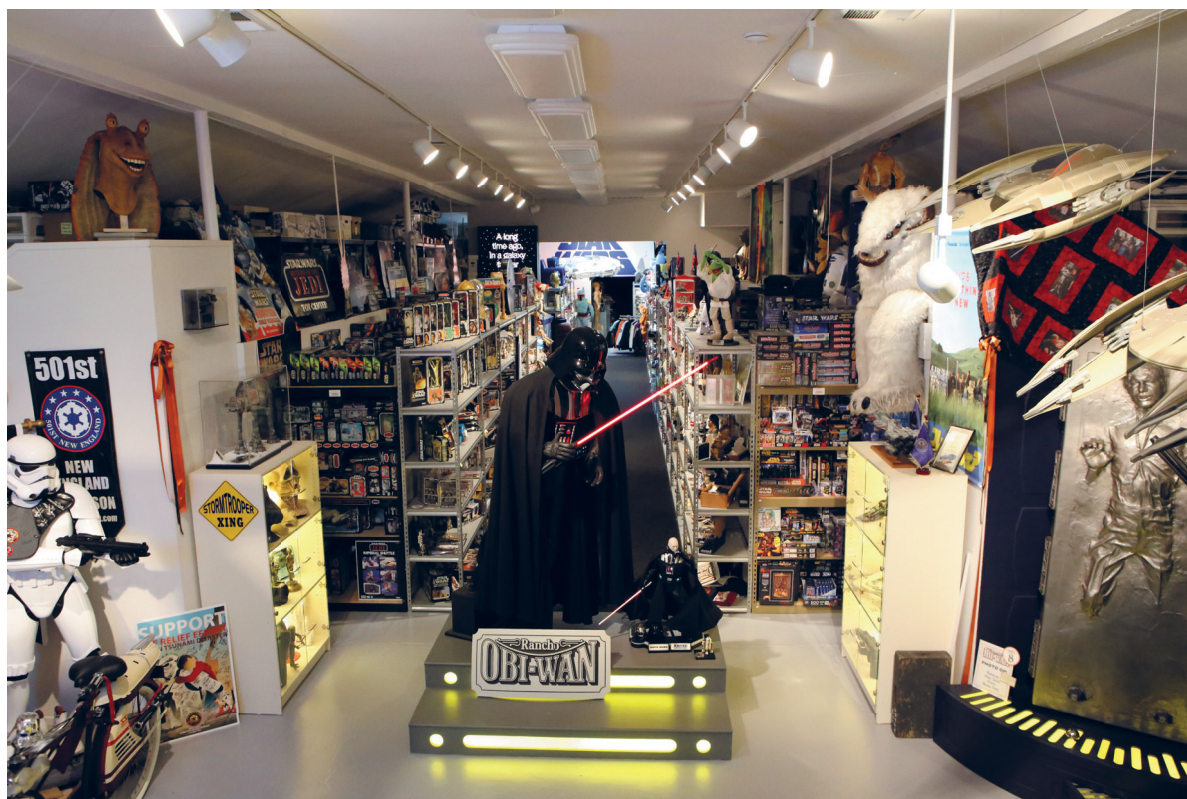
Главный зал на ранчо Оби-Ван.

Сансвит вырос в Филадельфии, учился на журналиста и писал о покушении на Кеннеди для студенческой газеты. Работая журналистом Wall Street Journal в Лос-Анджелесе в 1976-м, после статьи о коллекционере он стал собирать игрушечных роботов, которые пробудили детскую любовь к научной фантастике. Однажды на работе он заметил, как другой журналист выкинул в мусор приглашение. Оно было на закрытый показ для прессы нового фильма «Звездные войны». Сансвит достал приглашение из мусорной корзины, и через несколько дней его жизнь изменилась навсегда. То приглашение и программка с показа стали первыми предметами его коллекции. «Мне было уже за 30, — писал он, — но я понял, что именно этого ждал всю жизнь».