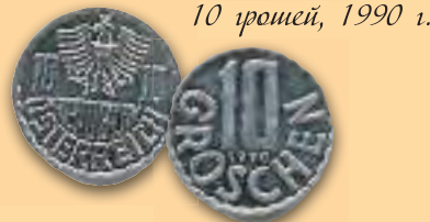
10 грошей, 1990 г.