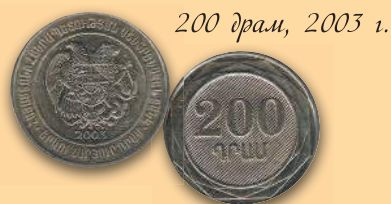
200 драм, 2003 г.

В марте 2003 г. появились новые монеты однотипного дизайна в 20, 50, 100, 200 и 500 драм.