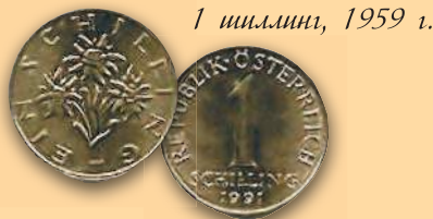
1 шиллинг, 1959 г.

1 января 2002 г. в Австрии введен евро – официальная валюта 17 стран Еврозоны).