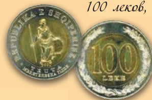
100 левов, 2000 г.

Аверсы современных монет Республики Албания украшены различными рисунками. На реверсы монет помещен номинал с растительным орнаментом или венком из ветвей оливы или оливы и дуба.