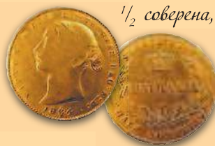
\frac{1}{2} соверена, 1866 г.

Все современные австралийские банкноты сделаны из специального пластика.