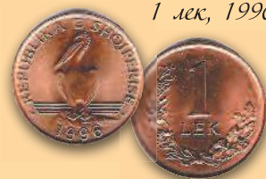
1 лек, 1996 г.