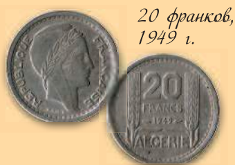
20 франков, 1949 г.

В 1992 г. был введен новый ряд монет, состоящий из \frac{1}{4} , \frac{1}{2} , 1, 2, 5, 10, 20, 50 и 100 динаров.