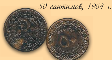
50 сантимов, 1964 г.