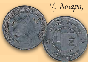
1/2 динара, 1992 г.