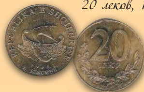
20 левов, 1996 г.