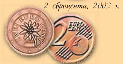
2 евроцента, 2002 г.