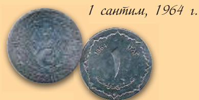
1 сантим, 1964 г.

Монеты 1 и 2 сантима больше не выпускаются. Монеты 5, 10 и 20 сантимов исчезли из обращения во второй половине 1980-х гг.