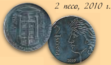
2 песо, 2010 г.

Монеты 1990-х гг. чеканились в основном из алюминиевой бронзы.