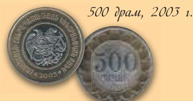
500 драм, 2003 г.

Большинство монет 1994 г. выпуска выведены из обращения.