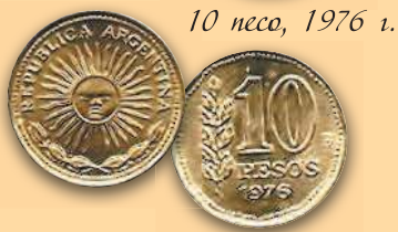
10 песо, 1976 г.

В 1950–1980-е гг. выпускались монеты со значимыми для страны изображениями на аверсе и указанием номинала на реверсе.