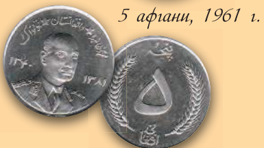
5 афгани, 1961 г.

В 2005 г. в Афганистане выпустили новую серию монет достоинством 1, 2 и 5 афгани.