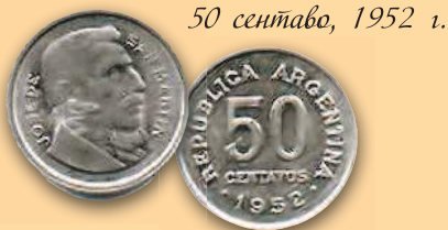
50 сентаво, 1952 г.

На аверсе ранних аргентинских монет чаще всего изображалась женщина во фригийском колпаке (символ свободы), на реверсе – герб или указание номинала.