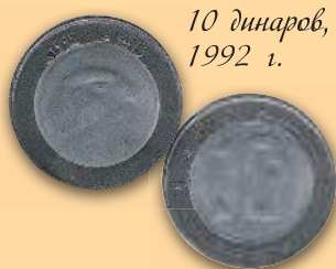
10 динаров, 1992 г.