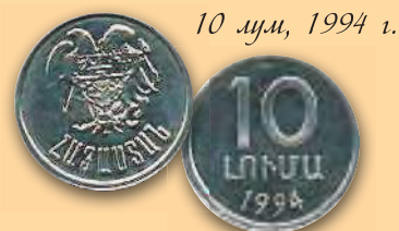
10 лум, 1994 г.

Первые монеты независимой Армении были введены в обращение в феврале 1994 г.