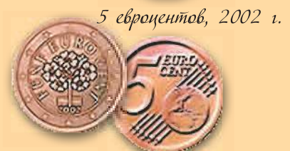
5 евроцентов, 2002 г.

На аверсе 1, 2 и 5 евроцентов изображены альпийские цветы. Сверху полукругом указан номинал. Внизу – дата выпуска. На реверсе в правой нижней части изображен земной шар, на котором видна карта Европы. На фоне земного шара – 6 диагональных линий и 12 звезд на их концах. Слева от карты – номинал.