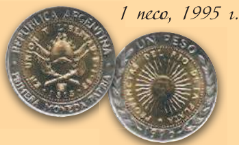
1 песо, 1995 г.

В 1950–1980-е гг. выпускались монеты со значимыми для страны изображениями на аверсе и указанием номинала на реверсе.