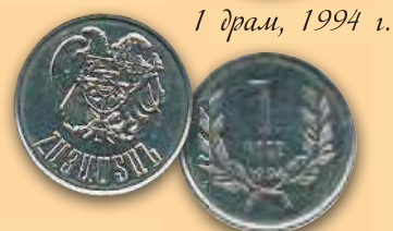
1 драм, 1994 г.

Все монеты 1990-х гг. выполнены в похожем дизайне. На аверсах герб Республики Армения и название страны на армянском языке. На реверсах указаны номинал и дата выпуска.