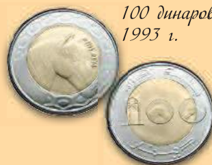
100 динаров, 1993 г.

На реверсе помещен стилизованный номинал, обрамленный арабской вязью. На аверсе – животное, как и на монетах другой стоимости.