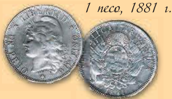
1 песо, 1881 г.

Официальная денежная единица – аргентинское песо, равное 100 сентаво.