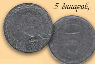
5 динаров, 1998 г.