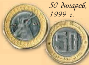
50 динаров, 1999 г.