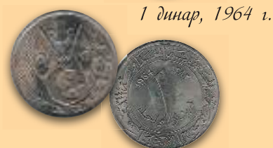
1 динар, 1964 г.

На аверсе всех монет изображен герб Алжира, на реверсе указано достоинство монет.