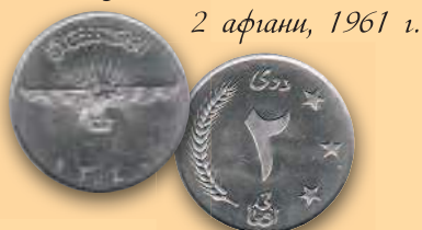
2 афгани, 1961 г.