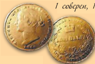
1 соверен, 1866 г.

Золотые соверены и полусоверены 1855–1870 гг. выпускались с портретом королевы Виктории (1837–1901 гг.) на аверсе и указанием монетного двора, страны-эмитента (Австралия) и номинала – на реверсе.