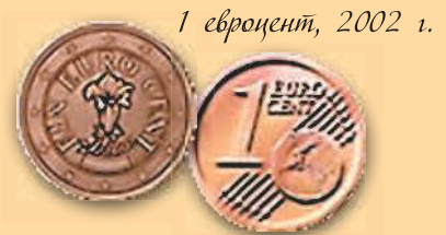
1 евроцент, 2002 г.

До введения евро (в период 1950–2001 гг.) чеканились монеты с различными графическими рисунками на аверсах и указанием номинала на реверсах.