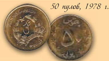
50 пулов, 1978 г.

В 2005 г. в Афганистане выпустили новую серию монет достоинством 1, 2 и 5 афгани.