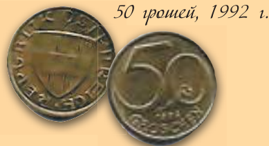
50 грошей, 1992 г.

До введения евро (в период 1950–2001 гг.) чеканились монеты с различными графическими рисунками на аверсах и указанием номинала на реверсах.