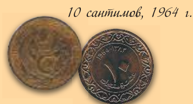
10 сантимов, 1964 г.