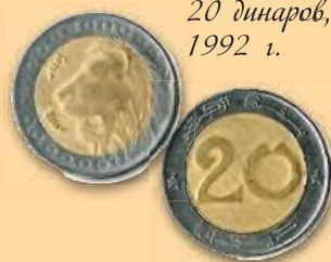
20 динаров, 1992 г.