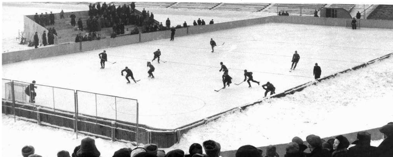
Москва. Вид с Восточной трибуны стадиона «Динамо», на котором в 1940–50-х годах шли хоккейные матчи