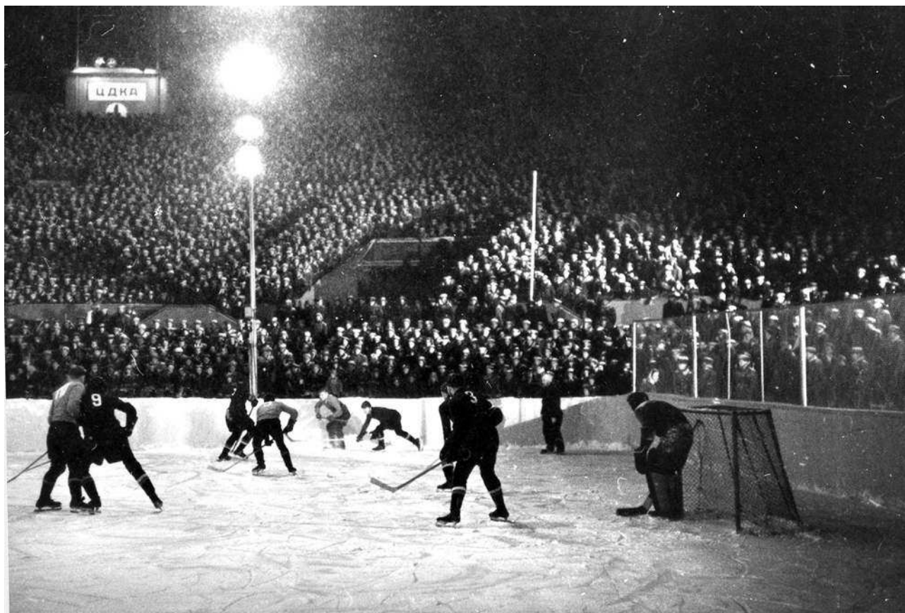
12.02.1949. «Спартак» – ЦДКА. 18 градусов мороза. Переполненная Восточная трибуна стадиона «Динамо»