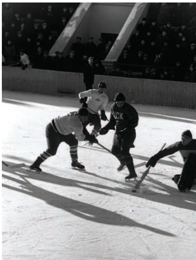
15.11.1956. «Спартак» – ЦСК МО. Москва. Летний каток «Сокольники», открывшийся в том году