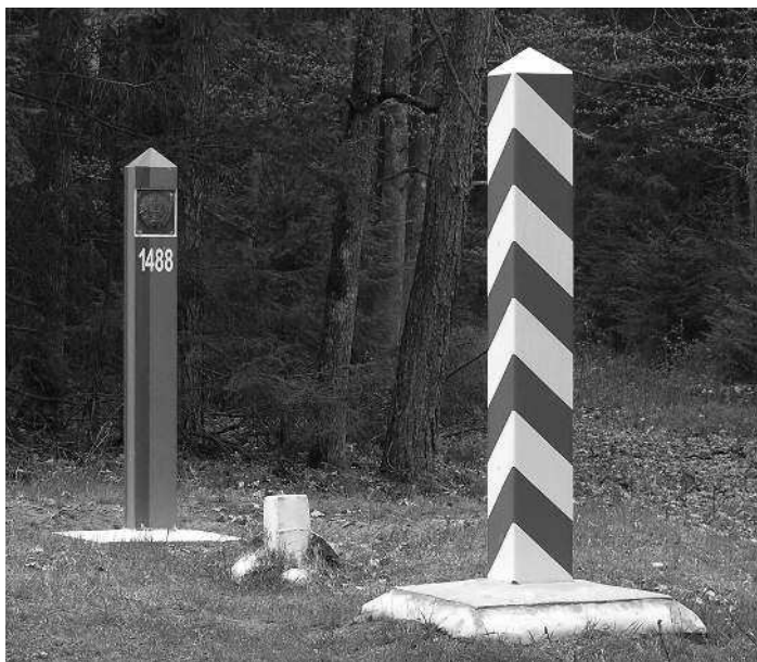
Пограничные столбы на российско-белорусской границе.

Охрана государственной границы производится Пограничной службой ФСБ России в пределах приграничной территории, а также Вооруженными силами России (войсками ПВО и ВМФ) — в воздушном пространстве и подводной среде. Обустройством пограничных пунктов ведает Федеральное агентство по обустройству государственной границы Российской Федерации.