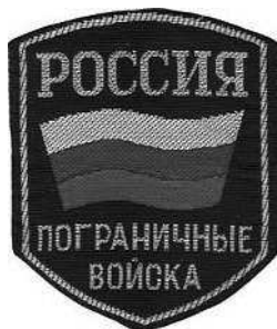
Нарукавный шеврон пограничника.

строительство гидроузла и водозаборных сооружений Самур-Дивичинского (позже Самур-Апшеронского) канала (административная граница проходила по правому берегу реки, и весь гидроузел располагался на территории