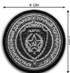
Шеврон Дальневосточного пограничного округа.

На сегодняшний день охрана границы представляет собой задачу, связанную не только с первоначальным отражением нападения агрессора и пресечением попыток несанкционированного пересечения рубежей государства. Таким образом, прошедшее в 2003 году