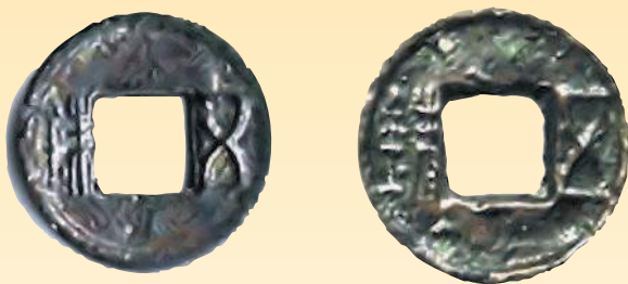
Монета с квадратным отверстием: 1 шу Китая, III в.