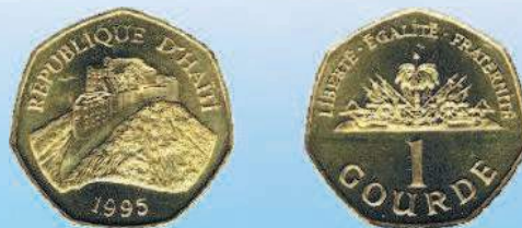
Многоугольная монета: 1 гурд Гаити, 1995 г.