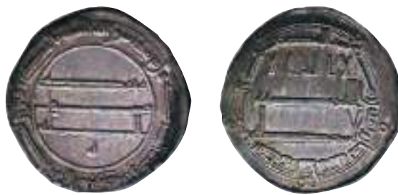
Серебряный дирхем халифа Харуна аль-Рашида, 809—810 гг.