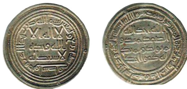
Серебряный дирхем халифа аль-Валида, 704—714 гг.

В конце X в. запасы серебра в арабских странах начали подходить к концу, поэтому качество дирхемов значительно ухудшилось. Арабы стали чеканить билонные (с незначительным содержанием серебра), а затем и медные монеты, которые, естественно, перестали котироваться на Руси. Их вполне успешно стали заменять западноевропейские денарии, которых также прозвали кунами. Появились в Древнерусском государстве и монеты собственной чеканки — златники (из золота) и сребреники (из серебра). Правда, они были столь немногочисленны, что не могли вытеснить из обращения иностранные деньги и заполнить собой весь обширный русский рынок.