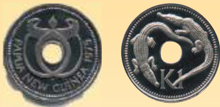
Монета с круглым отверстием: 1 кина Папуа и Новой Гвинеи, 1975 г.

Аверсом традиционно называют главную сторону монеты, которая указывает на ее государственную принадлежность. Как правило, на аверсе помещен портрет правящего монарха, государственный герб, а также эмблема, легенда с названием страны или обозначение банка-эмитента.