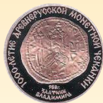
Реверс памятной золотой монеты 100 рублей СССР, 1988 г. Монета посвящена 1000-летию монетной чеканки на Руси. На аверсе изображен златник киевского князя Владимира.

Аверс: изображение Константина VII и его сына Романа II. Реверс: изображение Иисуса Христа.