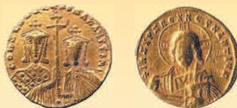
Золотой византийский солид императора Константина VII, 945—955 гг.

Аверс: изображение Константина VII и его сына Романа II. Реверс: изображение Иисуса Христа.