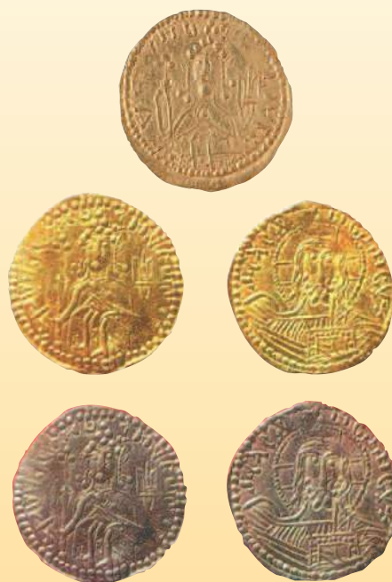
Златник Владимира Святославича, около 988—989 гг.