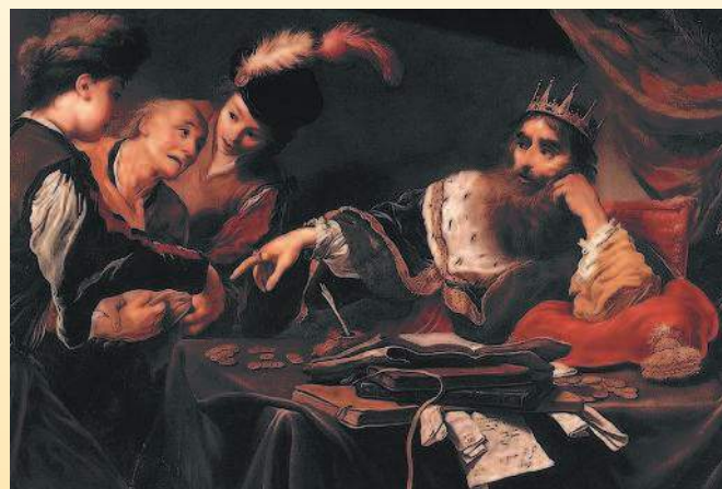
Клод Виньон . «Царь Крез получает дань от лидийских крестьян» (1629 г.).

Начиная с XIX в. монеты постепенно перестают выступать в качестве основного платежного средства, уступая более дешевым в производстве и удобным в обращении банкнотам. В наше время существуют государства, в оборотах которых находятся исключительно бумажные либо пластиковые деньги. И все же в большинстве стран мира продолжается чеканка полноценных, разменных (дробных), памятных (юбилейных), коллекционных, а также инвестиционных монет. Полноценные и разменные мо-