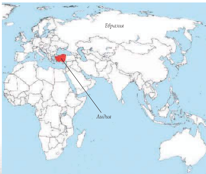
Красным выделена территория государства, где появились первые монеты.

Металлические денежные знаки, имевшие определенную форму, массу и достоинство и выступавшие в качестве законного платежного средства, впервые стали называть латинским словом «moneta» в середине III в. до н. э. в Древнем Риме. Именно в Вечном городе в 268 г. до Рождества Христова при храме богини Юноны (супруги верховного римского бога Юпитера) была открыта мастерская по чеканке бронзовых и медных ассов, а также серебряных денариев. Юнона, как известно, считалась покровительницей браков и охранительницей семей, поэтому римляне часто величали ее «Moneta», что в переводе с латинского языка означает «советчица». Поэтому нет ничего удивительного, что продукция мастерской, расположенной возле храма Юноны Монеты, в народе окрестили монетами.