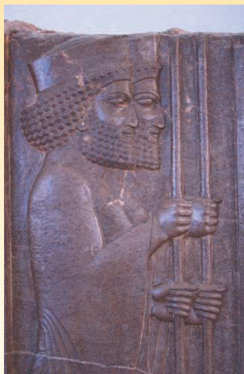
Фигуры античных персидских воинов на одной из стен среди руин древнеперсидского города Персеполь.

Начиная с XIX в. монеты постепенно перестают выступать в качестве основного платежного средства, уступая более дешевым в производстве и удобным в обращении банкнотам. В наше время существуют государства, в оборотах которых находятся исключительно бумажные либо пластиковые деньги. И все же в большинстве стран мира продолжается чеканка полноценных, разменных (дробных), памятных (юбилейных), коллекционных, а также инвестиционных монет. Полноценные и разменные мо-