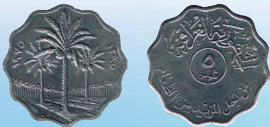
Монеты с волнистым краем: 5 филсов Ирака, 1975 г.

Производственные предприятия, занимающиеся чеканкой монет, а также орденов, медалей и других металлических знаков по заказу государства, называются монетными дворами. В Российской Федерации в наше время действует 2 монетных двора: в Москве и Санкт-Петербурге. Причем монетный двор в Санкт-Петербурге считается одним из крупнейших в мире. Основан он был в далеком 1724 г. всероссийским императором Петром I.