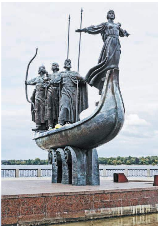
Памятник основателям Киева. На скульптурной композиции представлена ладья с легендарными полянскими князьями Кием, Щеком, Хоривой, а также с их сестрой Лыбедью. Именно они, согласно «Повести временных лет», основали город на холмах.

Киево-Печерская лавра — один из первых монастырей в Древнерусском государстве (возведен в середине XI в.).