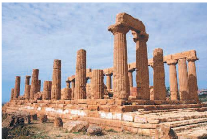
Развалины храма Юноны Монеты.