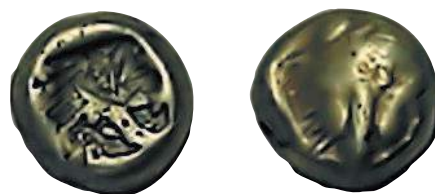
1/3 статера Лидии царя Ардиса II, 644—629 гг. до н. э.

Лидийские статеры использовались не только как платежное средство. Их активно подносили различным божествам во время религиозных церемоний. Даже цари щедро задабривали своих богов, отдавая огромные суммы храмам. После получения щедрых даров местные жрецы-оракулы делали предсказания (от имени богов, разумеется), определяя судьбу государства. Однако даже боги не спасли Лидию от краха. Царь Крез, готовясь к войне с персидским правителем Киrom Великим, пожелал услышать предсказание о предстоящих баталиях. Оракул дал двусмысленный ответ: «Если царь переступит через реку, то он разрушит великое царство». Крез подумал, что раз лидийцы снабжают монетами богов, то в руинах окажется Персидское царство. И прогадал. В 546 г. персы разгромили лидийские войска, Лидия была уничтожена навсегда. А Кир Великий захватил лидийские монетные дворы и получил самую совершенную на тот момент технологию изготовления монет, которая быстро распространилась на территории Персии, Греции, Карфагена и других античных государств. Также в VI в. до н. э. были созданы собственные технологии изготовления монет в Китае и Индии.