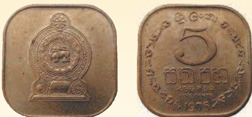
Монета в форме квадрата с закругленными краями: 5 центов Шри-Ланки, 1975 г.