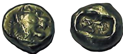
1 лидийский статер царя Алиатта, 610—560 гг. до н. э. Аверс: голова льва. Реверс: 2 прямоугольника.