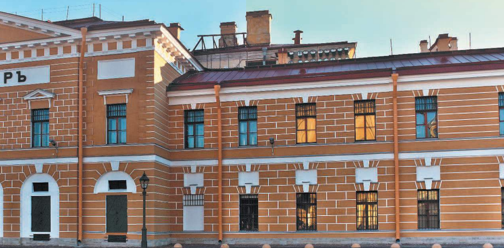
Монетный двор в Санкт-Петербурге.