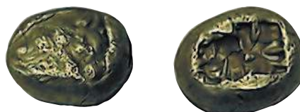
1 статер из электра царя Ардиса II, 644—629 гг. до н. э.

В горных ручьях юго-западной Турции добывали первый материал для изготовления монет — электрум.