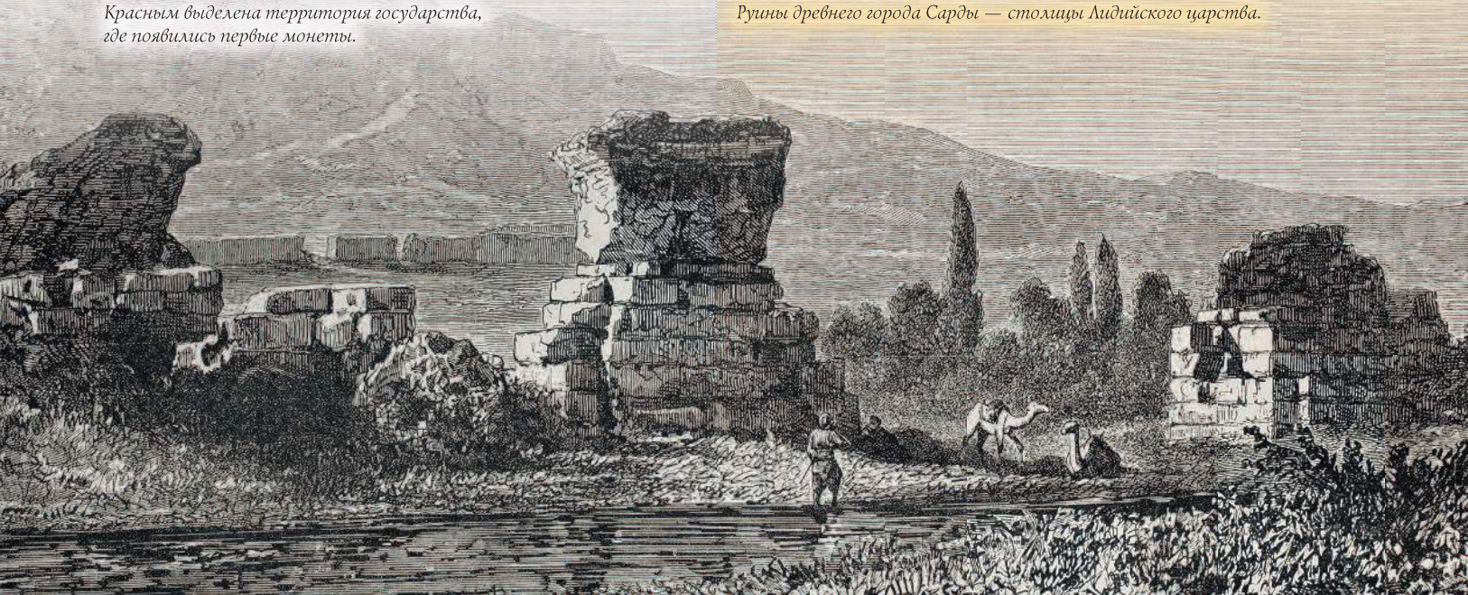
Руины древнего города Сарды — столицы Лидийского царства.

Первые упоминания о лидийских монетах встречаются в работах древнегреческого историка Геродота (около 485 — около 425 гг. до н. э.) и датируются 687 г. до н. э. Первые монеты изготавливались из кусков электрома (электра) — естественного сплава серебра и золота, а также небольшой массы других металлов. Этот сплав в достаточных количествах находили в горных ручьях Лидии. Для смягчения его предварительно нагревали, затем помещали на пластину и обрабатывали молотом. Вычеканенное на одной стороне изображение и стало считаться номиналом денежного средства. Первые в мире монеты назывались статерами, в честь древнегреческой весовой единицы, равной 1/50 части мины, или приблизительно 12 г. Массовая чеканка