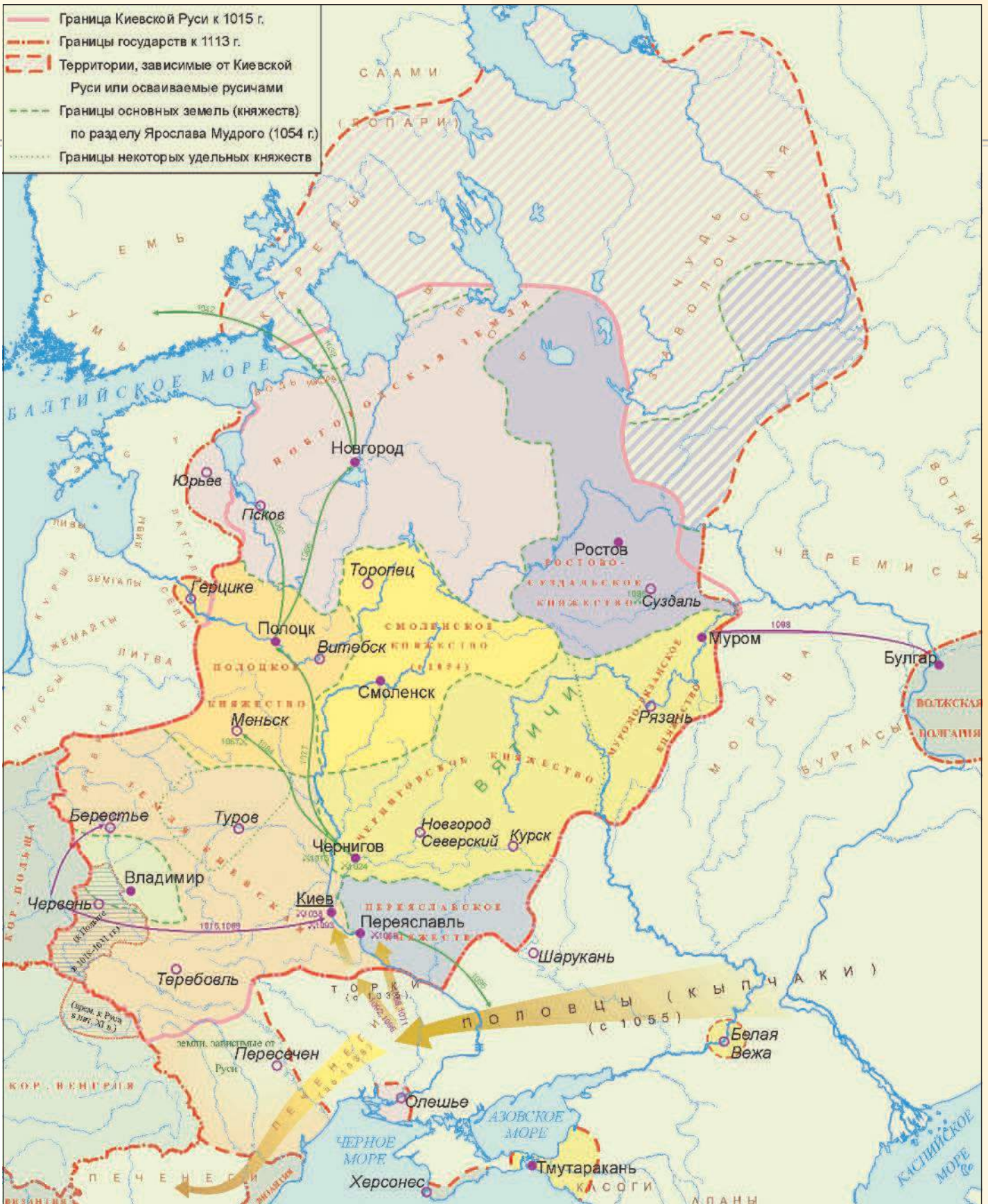
Карта Руси в 1015—1113 гг.