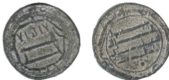
Серебряный дирхем халифа аль-Махди, 781 г.