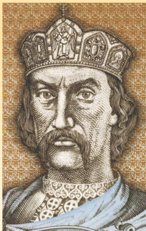
Портрет киевского князя Владимира I (958—1015 гг.) на украинской банкноте номиналом 1 гривна (1995 г.).

Гривной на Руси называли не только весовую меру, но и вполне увесистые серебряные слитки. Изредка встречались даже золотые гривны, которые стоили в 12,5 раза дороже серебряных. Сам термин «гривна» произошел от древнерусского украшения, которое напоминало обруч, а носили его на шею («загривке»). В XI в. наиболее распространенными являлись так называемые киевские гривны, имевшие шестиугольную форму и весившие 160–165 г. Во 2-й половине XII в., после распада Киевской Руси, их стали вытеснять новгородские гривны. Они представляли собой длинные серебряные палки, масса которых составляла 204 г. Именно новгородские слитки распространились в XIII в. на территории всех удельных княжеств и стали главным платежным средством восточнославянских земель того периода.