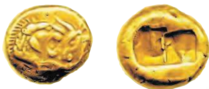
Золотой статер царя Креза, 560—546 до н. э. Аверс: головы льва и быка. Реверс: 2 прямоугольника.