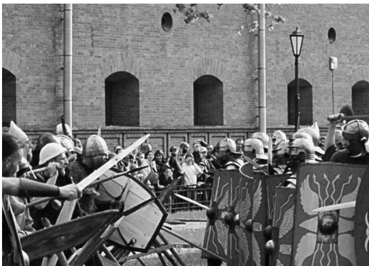
Римский легион отражает атаку варваров. II в. н.э. Фестиваль «Семь эпох» (Санкт-Петербург).

Про славян VI–VII столетий мы знаем намного больше.