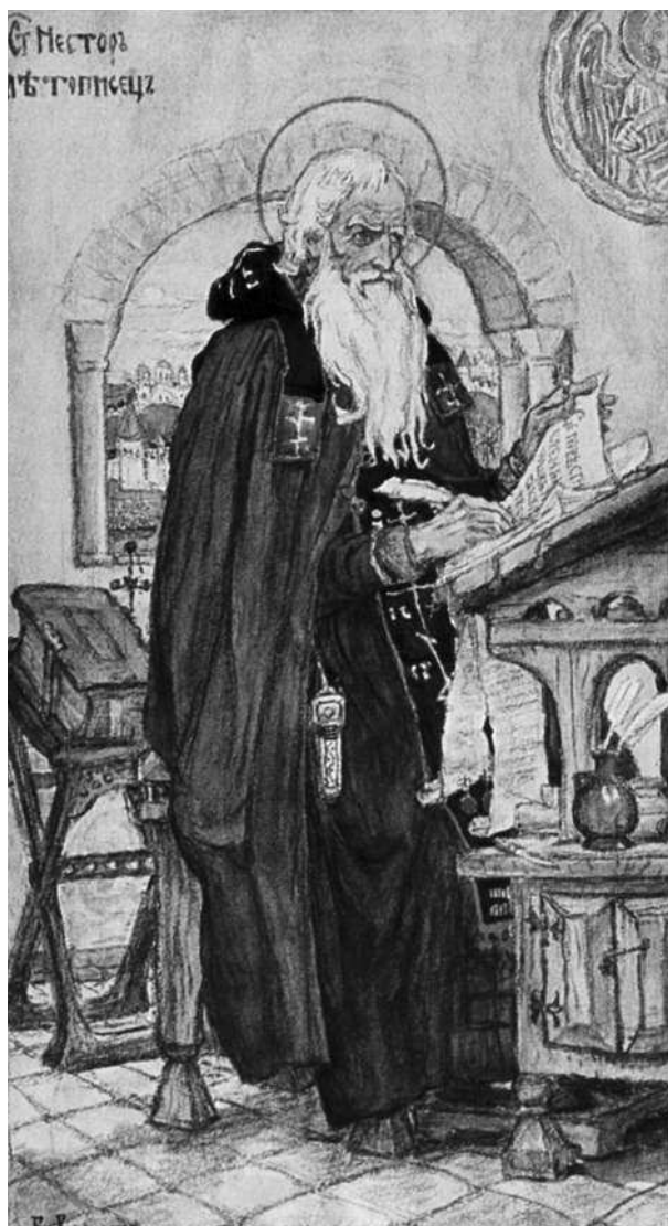
В. М. Васнецов. НЕСТОР-ЛЕТОПИСЕЦ.

Нестор был одним из редакторов «Повести временных лет», он работал над нашей летописью во второй половине XI столетия