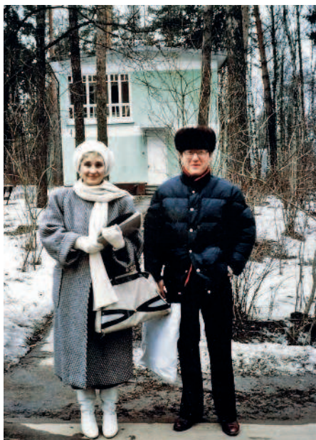
Подмосковье. 1988 г.