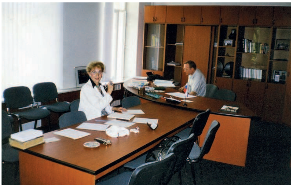
Подготовка к конференции в Дипломатической академии МИД России

туте оборонных исследований при Управлении обороны, Институте мировой политики и экономики при Кабинете министров Японии и других престижных центрах образования и науки.