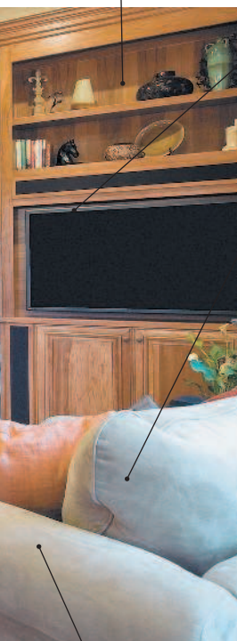
le vaisselier сервант