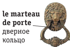
le marteau de porte дверное кольцо