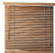
le store vénitien жалюзи