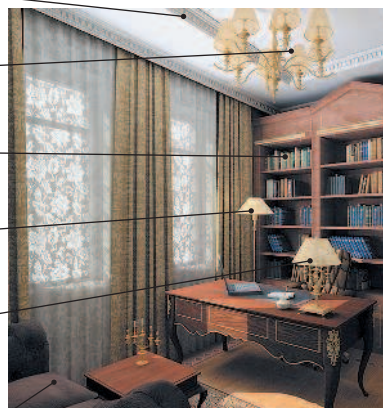
le bureau кабинет