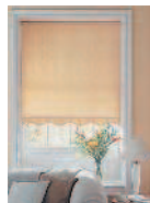
le store штора