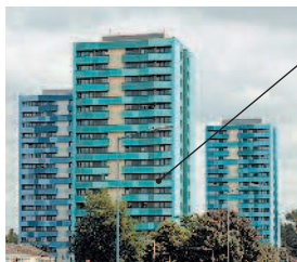
l'immeuble многоквартирный дом