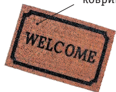
le tapis-brosse коврик