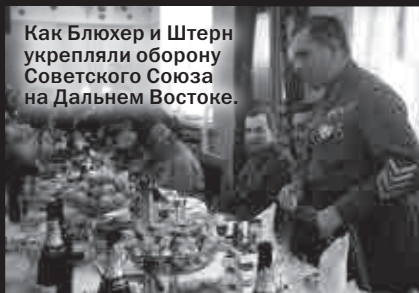
Как Блюхер и Штерн укрепляли оборону Советского Союза на Дальнем Востоке.