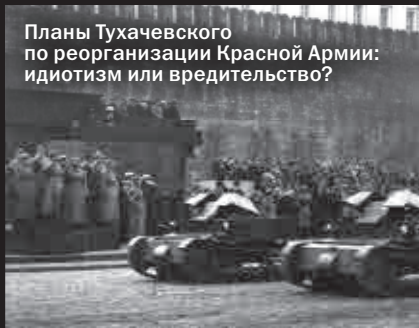
Планы Тухачевского по реорганизации Красной Армии: идиотизм или вредительство?