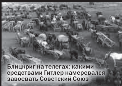
Блицкриг на телегах: какими средствами Гитлер намеревался завоевать Советский Союз

Эта книга переворачивает наши представления о причинах и последствиях репрессий 1937–1939 годов, когда Сталин, готовясь завоевать Европу под прикрытием коммунистической идеологии, безжалостно избавлялся от всех, кто мог помешать реализации его грандиозных планов. Виктор Суворов убедительно показывает, что сталинская чистка высшего командного состава Красной Армии была не результатом заговора или борьбы за власть между влиятельными кланами в руководстве страны и не следствием параноидальности вождя, а очередным этапом подчинения карательной машины Советского Союза и наведения порядка в вооруженных силах, сделавшим Красную Армию гораздо более боеспособной, что в конечном итоге позволило одержать победу в войне с Германией.