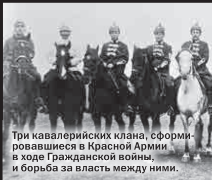
Три кавалерийских клана, сформировавшиеся в Красной Армии в ходе Гражданской войны, и борьба за власть между ними.