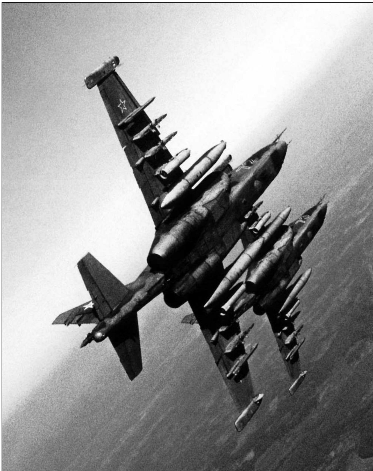
В полете на полигон. Пара штурмовиков Су-25 несет ПТБ и штурмовые авиабомбы ОФАБ-250ШЛ