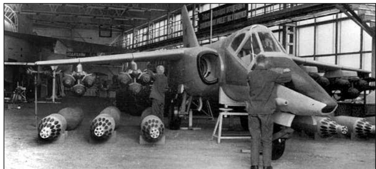
Доработанный макет легкого самолета-штурмовика (ЛСШ) с выкладкой вариантов вооружения

Изначально наладить выпуск штурмовиков предполагалось на Новосибирском авиационном заводе им. В.П. Чкалова. Передача конструкторской документации началась уже в конце 1969 года с тем, чтобы завод участвовал в строительстве опытных самолетов. Но в то время завод был загружен работами по Су-24, испытывал проблемы производственного и технологического толка и без того имел значительное отставание от плана. К тому же финансирование работ по штурмовику так и не