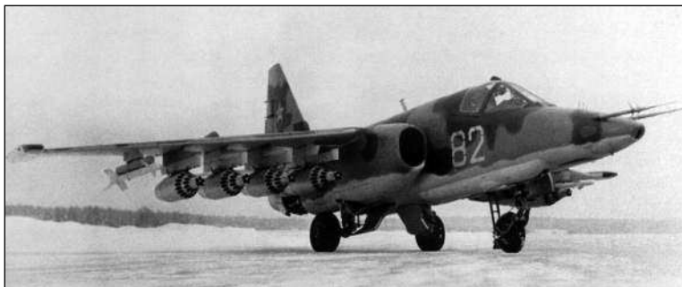
Т8-2 на аэродроме ЛИИ МАП в Жуковском. Под крылом блоки НАР УБ-32А-73 и макеты ракет «воздух-воздух» Р-3С

Тем же Постановлением предписывалось заменить двигатели на самолете на более мощные, поскольку с Р9-300 Су-25 недотягивал до заданных летных характеристик. Взгляды конструкторов вновь обратились к еще не существующим перспективным ТРДД, но на «бумажных» двигателях самолет летать не мог. Вновь требовалось иное, доступное решение. Первоначально рассматривался вопрос о форсировании Р9-300, который в варианте «изделие 39Ф» мог развивать тягу до 3800 кгс. Однако после всестороннего рассмотрения характеристик этого варианта двигателя стало ясно, что и с ним выполнить в полной мере все требования ТТТ на самолет невозможно. Все работы по Р9-300 по указанию МАП были в итоге свернуты.