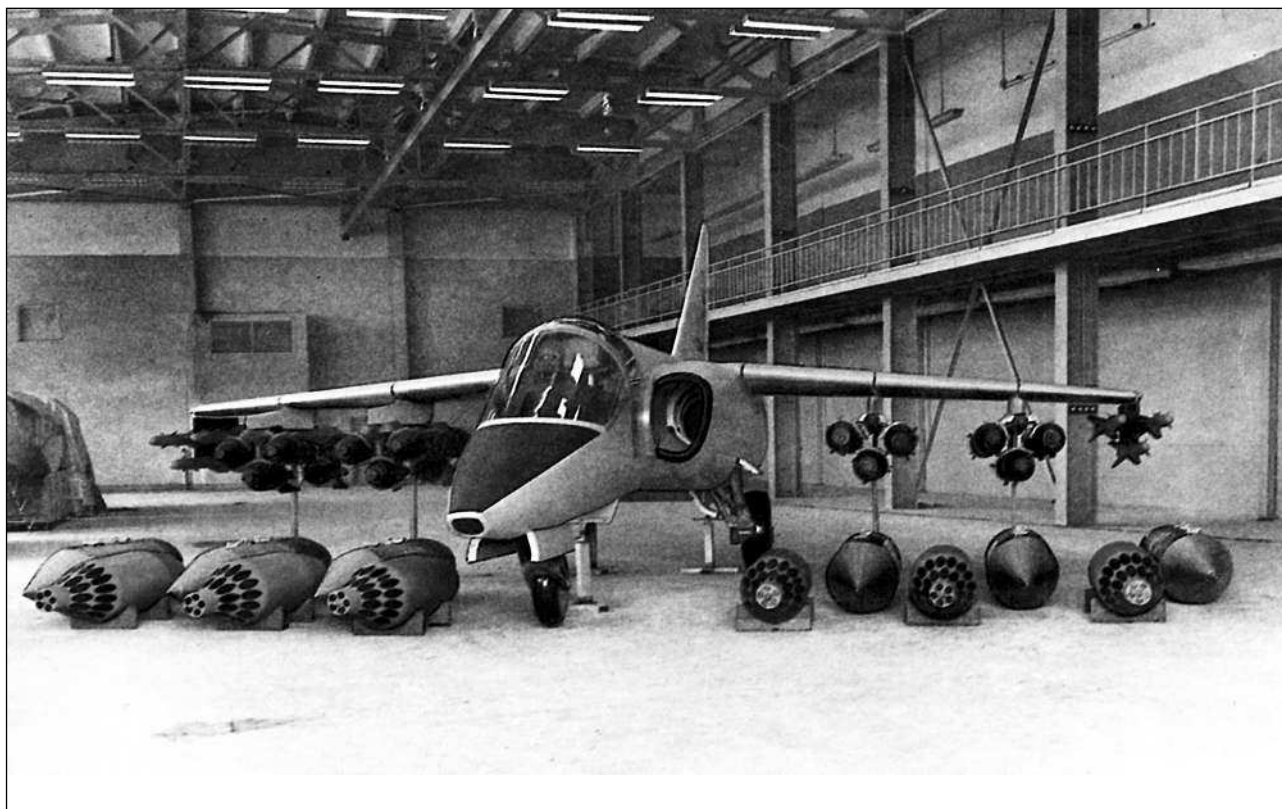
Макет СПБ в цехе МЗ «Кулон», 1969 год