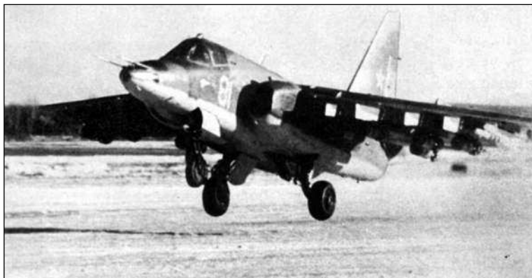
Испытания Т8-1 на заснеженном аэродроме. Самолет доработан увеличенным по высоте килем и несет под крылом 100-кг авиабомбы и ракеты «воздух-воздух»

— обладает широкими возможностями при действии по наземным и воздушным целям в тактической и ближ-