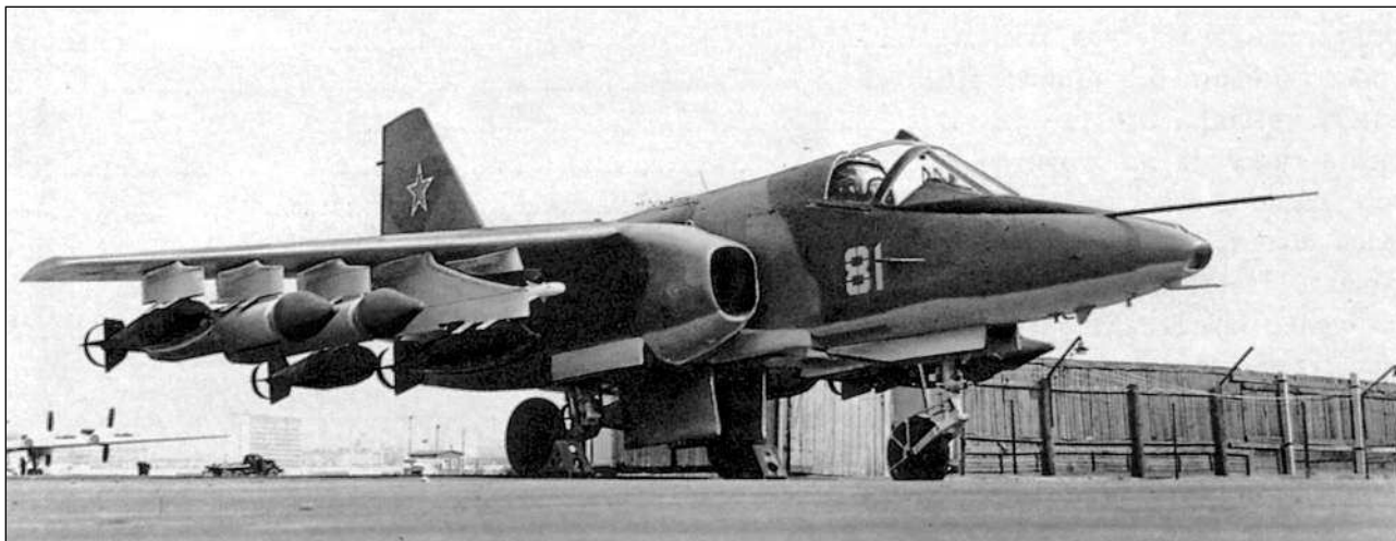
Макет легкого войскового самолета-штурмовика (ЛВСШ) во время показа на Центральном аэродроме в Москве

было, и руководство предприятия вовсе не стремилось вкладывать в проект собственные средства. В 1970 году в ОКБ было выполнено 90 % чертежей каркаса, систем и установок оборудования. На опытном производстве филиала МЗ «Кулон» в Новосибирске были установлены стапели для агрегатной и общей сборки самолета. В июле 1970 года была построена носовая часть фюзеляжа штурмовика, заготовлены детали силового набора и обшивки.