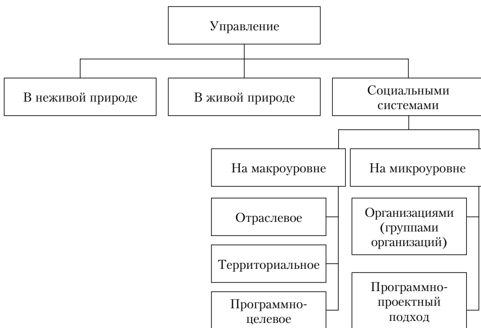
Рис. 1.1. Всеобщий характер теории управления и структура системы управления социальными системами

И. Кеплера, Г. Кирхгофа, Дж. П. Джоуля, А. Л. Ле Шателье, составляющих содержание наук о неживой природе — от астрономии до микроэлектроники и физики элементарных частиц.