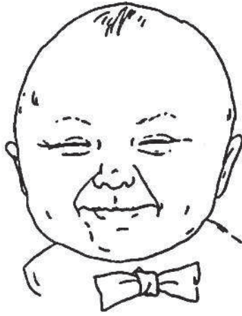
Мирзакарим Санакулович Норбеков

Доктор психологии, доктор педагогики, доктор философии в медицине, профессор, действительный член и член-корреспондент ряда российских и зарубежных академий, автор многих запатентованных изобретений и открытий в науке.