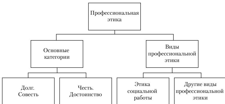
Рис. 1.2. Структура профессиональной этики

В современном значении термин «профессия» указывает не только на некий круг проблем, но и на набор приемов и принципов (в том числе этических), с помощью которых можно эти проблемы выявлять и решать. Важнейшим фактором, определяющим профессиональную автономию специалиста и независимость выражаемой им позиции, наряду со знаниями, навыками, умениями, и выступает профессиональная этика. Она конкретизирует принципы, нормы и категории этики применительно к сфере действия и в соответствии с особенностями профессиональной деятельности, показывает характер воздействия общих принципов и норм на практику профессиональных отношений, раскрывает то, как они откладываются в сознании каждого человека (той или иной специальности) и выполняются в его поступках. Структура профессиональной этики представлена на рис. 1.2.