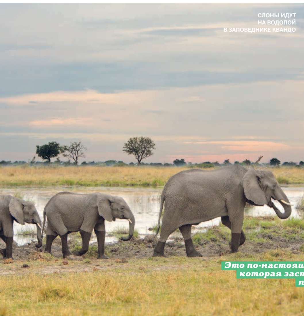
слоны идут на водопой в заповеднике Квандо

Прямые рейсы. Уже много лет правительство пытается наладить прямые международные рейсы. Теперь, поскольку офис алмазной корпорации De Beers (оборот $6,5 млрд в год) переехал из Лондона в Габороне, что-то обязательно должно измениться. В Габороне, Мауне и Касане в настоящее время идет ремонт зданий аэропортов и полос руления. Все очень надеются, что это наконец свершится месяцев через 6-12. • Пола Харди